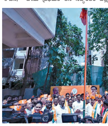
నిబద్ధతను చాటుకునే గర్వకారణమైన రోజునే పేర్కొన్నారు. సామాన్య కార్యకర్తల బలంగా, దేశ హితం వరమాపదగా ప్రారంభమైన బిజెపి నేడు

ప్రపంచంలోనే అతిపెద్ద రాజకీయ శక్తిగా ఎదిగింది. నాడు శ్యామల ప్రసాద్ ముఖర్జీ, దీన్ దయాళ్ ఉపాధ్యాయ, అలల్ బిఖారీ వాణిశ్యం వంటి మహనీయులు చేసిన పునాదులపై నేడు పార్టీ ఆస్తిగా దూసుకుపోతుందని అన్నారు. తెలంగాణలో ప్రజా స్వామ్య పరిరక్షణ కోసం, ప్రజల గౌరవంగా ప్రతి కార్యకర్త పని చేయాలన్నారు. ప్రధాని మోడీ నాయకత్వంలో దృఢమైన, స్వయం సమృద్ధమైన విక