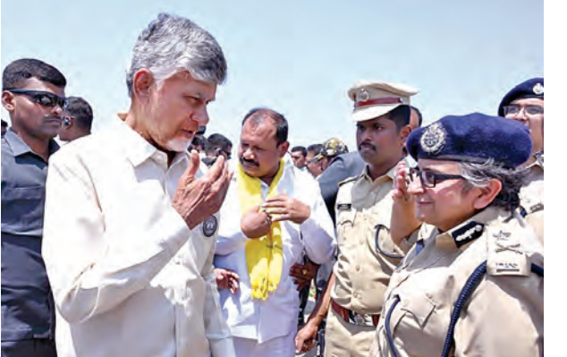
జిల్లా పర్యటనకు వచ్చిన సీఎంకె స్వాగతం పలుకుతున్న అధికారులు

విజయవాడ, ఏప్రిల్ 6 ప్రభాతవార్త ప్రతినది: పోలీసు కుటుంబాలకు ఎపి ప్రభుత్వం నిరంతరం అండగా ఉంటుందని హోం మంత్రి వంగలపూడి అనిత తెలిపారు. అటువంటి ఇబ్బంది వచ్చినా పోలీసులను ప్రభుత్వం అడుగుంటుంది దన్నారు. కృష్ణా జిల్లా చల్లపల్లి పోలీస్ స్టేషన్లో పేలుడు ఫుటల్ గాయపడ్డ పోలీసులను హోంమంత్రి అనిత పరామర్శించారు. మంగళగిరి ఎన్ఆర్ఎ హోంస్టేషన్లో బీకెట్ పొందుతున్న పోలీసులకు హోంమంత్రి డైరెక్షన్ చెప్పారు. పోలీసుల కుటుంబ సభ్యులతో మాట్లాడి, ప్రభుత్వం అండగా ఉంటుందని భరోసా ఇచ్చారు. పోలీసులకు మెరుగైన వైద్యం అందించాలని అధికారులకు హోంమంత్రి అనిత ఆదేశాలు ఇచ్చారు. ఈ సందర్భంగా హోం మంత్రి అనిత మాట్లాడుతూ కృష్ణా జిల్లా చల్లపల్లి పోలీస్ స్టేషన్ వద్ద అనుమతులు లేకుండా లాకప్ కార్యకలాపాలు నిర్వహిస్తున్న దురాచార నుంచి సీజ్ చేసిన టిపాసులను కోర్టుకు తరలిస్తుందా పేలుడు బెదిరింపులను వారు కుటుంబ సభ్యులను ప్రభుత్వం అన్ని విధాలుగా అడుగుంటుందని స్పష్టం చేశారు. ఎంతో ప్రత్యేక శ్రద్ధతో వైద్యం అందిస్తున్న ఎన్ఆర్ఎ హోంస్టేషన్లలో పోలీసులకు హోం మంత్రి అనిత ప్రత్యేక ధన్యవాదాలు తెలియజేశారు.