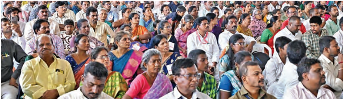
సోమవారం యాడికి సీఎం చంద్రబాబు సభకు హాజరైన రైతులు, అభిమానులు

ప్రజల ముందే ప్రగతి నివేదికలపై సీఎం చంద్రబాబు ప్రజెంటేషన్