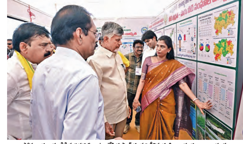
సోమవారం యాడికి సభ పద్ధ ఏర్పాటు చేసిన స్టాల్స్ ను పరిశీలించే సీఎం చంద్రబాబునాయుడు

>>> పాలయ్యారు. ఈ ఇద్దరు తిరుపతి కోర్టులో జూనియర్ అసిస్టెంట్, ఫీల్డ్ అసిస్టెంట్లుగా పనిచేస్తున్నారు. గంగవరం పోలీసులు మృతదేహాలను పలమనేరు ప్రభుత్వ అనుపతికి తరలింపే కేసు దర్యాప్తు చేస్తున్నారు.