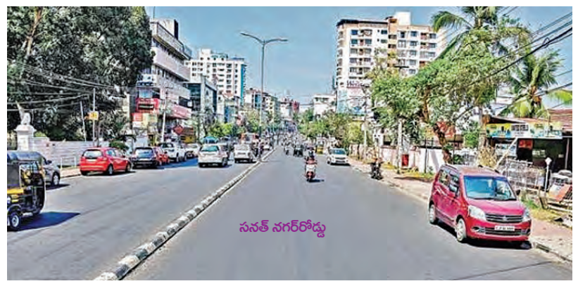
విజయవాడలో ట్రాఫిక్ నియంత్రణకు ప్రత్యామ్నాయ రోడ్లు

ఏలూరు, ఏప్రిల్ 6: ఏలూరు జిల్లాలోని గోపాలపురం, దేవరపల్లి, నల్లజర్ల మండలాలలో సోమవారం ఈదురు గాలులతో కూడిన భారీ వర్షం కురిసి బీభత్సం సృష్టించింది. ఇది వేసవి ఎండల నుండి తాత్కాలిక ఉపశమనం కలిగించినప్పటికీ, వలువోట్ల వెల్లువి విగిరినట్లు వంటి నష్టానికి దారితీసింది. సాధారణ నుంచి విస్తారమైన వర్షాల కురుస్తాయని వాతావరణశాఖ ముందుగానే హెచ్చరించింది. అయితే ఈదురు గాలులతోపాటు ఏలూరు పట్టణంలో సుడిగాలి బీభత్సం సృష్టించడంతో నగరంలోని >>2