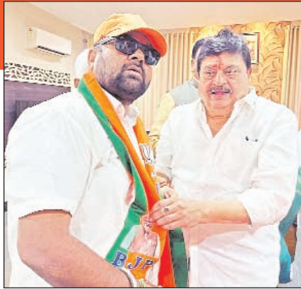
అంకితభావంతో పనిచేస్తానని స్పష్టం చేశారు.