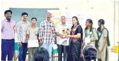
కనీసం, ఏప్రిల్ 6, ప్రభాతవార్త