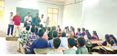
కనీసం, ఏప్రిల్ 6 ప్రభాతవార్త