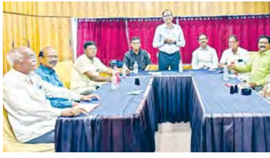
అనకాపల్లి, ఏప్రిల్ 6, ప్రభాతవార్త