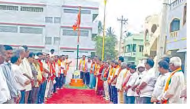
ఎలమంచిలి, ఏప్రిల్ 06, ప్రభాతవార్త