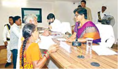
జిల్లా కలెక్టరు విజయ కృష్ణన్ అనకాపల్లి, ఏప్రిల్ 6, ప్రభాతవార్త