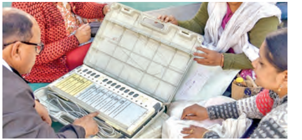
విజ్ఞప్తి చేశారు. అసోంలోని 126 స్థానాలకు, కేరళలోని 140 స్థానాలకు, పుదుచ్చేరిలోని 30 స్థానాలకు గురువారం పోలింగ్ జరగనుంది. ఎన్నికల సంఘం ఇందుకు సంబంధించి ముఖ్యంగా ఏర్పాట్లు చేస్తోంది.

న్యూఢిల్లీ, ఏప్రిల్ 7: అసోం, కేరళ, పుదుచ్చేరి అసెంబ్లీ ఎన్నికల ప్రచారం ముగిసిన సాయంత్రం ముగిసింది. ఏప్రిల్ 9వ తేదీ గురువారం ఆయా రాష్ట్రాల్లో ఒకే విధంలో పోలింగ్ జరుగుతుంది. అఖిల రోజు అన్ని పార్టీలు ప్రచారాన్ని హోరెత్తించాయి. కేరళలో కాంగ్రెస్, బిజెపి, అధికార ఎల్ డిఎమ్ పార్టీలు ఒకరిపై ఒకరు విమర్శల దాడిని తీవ్రతరం చేశాయి. ఇదే సమయంలో, 2021లో ఇచ్చిన హామీలలో 97 శాతాన్ని నెరవేర్చినట్లు పేర్కొంటూ ఎల్ డిఎమ్ ఒక ప్రగతి నివేదికను విడుదల చేసింది. మరోవైపు పుదుచ్చేరిలో, కేంద్ర పాలిత ప్రాంత శాసనసభ పూర్తి స్థాయి రాష్ట్ర హోదా కల్పించాలని కోరుతూ 14 సార్లు తీర్మానాలు చేసినప్పటికీ, కేంద్ర ప్రభుత్వం ఆ దిశగా ఎటువంటి ఆసక్తి చూపలేదని తమిళనాడు ముఖ్యమంత్రి, డిఎంకె అధ్యక్షుడు ఎం.కె. స్టాలిన్ ఆరోపించారు. అసోంలో శాంతి, అభివృద్ధి నిరంతరం కొనసాగాలంటే కాంగ్రెస్ పార్టీని అధికారానికి దూరంగా ఉంచాలని ప్రధానమంత్రి నరేంద్ర మోడీ సోమవారం (ఏప్రిల్ 6, 2026) ఓటర్లకు