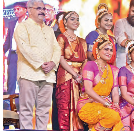
బుధవారం విశాఖ ఆయిల్లో జరిగిన సాంస్కృతిక కళాకారులతో డి.సిఎం పవన్

భక్తులకు కలుగుతుంది. సామాన్యభక్తులు ఆ దేవుని క్షణకాల దర్శనం కోసం పరితపిస్తుంటే ధనవంతులైన, కోటిశ్వరులైన భక్తులకు, దాతలకు తిరుమల తిరుపతి దేవస్థానం బహుశ్రీప్రయోజనాలు చేకూరుస్తోంది. గతంలో కోటి రూపాయలు, 1,50కోట్ల రూపాయలు దాతలు విరాళమిస్తే వాటికి ఏడాదిలో ఆరుమందికి ఉదయాసమాన సేవదర్శనం లిక్కే (తెలువారూ జామను సుప్రభాతం నుండి సాయంత్రం సహస్ర బేదాలంకారసేవ వరకు)అలయంలోపల కులేశ్వరపడి వద్ద నుండి వేంకటేశ్వరస్వామి కొలువైన ముందుకు వెళ్ళి తనవీతంగా దర్శనం చేసుకునే వెసులు బాటు కల్పించింది. అంతేకాక ఆ భక్తులకు సుప్రభాతం, తోమల, అర్చన సేవలు కొందరు గృహస్థభక్తులు, వివిధ జాతీయ మరీకొందరు గృహస్థభక్తులను దాత తీసుకోవే ప్రయోజనం ఉండేది. ఆ విరాళాల్లో కొంత మార్పుచేసి కోటి రూపాయలు విరాళమిస్తే ఆ దాతలకు ఏడాదిలో మరిన్ని ప్రయోజనాలు, దేవుని దర్శనం, వసతి, ప్రసాదాలు అందించే దిశగా కార్యాచరణ రూపొందించి