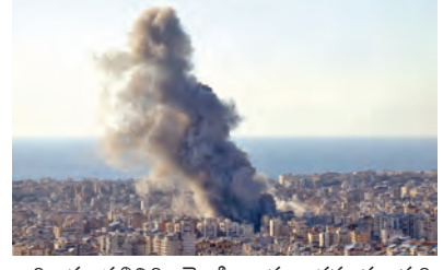
అధికార ప్రతినిధి వెల్లడించారు. పలువురు శుద్ధి కేంద్రాలు, విద్యుత్ స్టేషన్లు, డ్రాస్ దాడులు జరిగడంతో భారీ నష్టం వాటిల్లినట్లు పేర్కొన్నారు. యునైటెడ్ అరబ్ ఎమిరేట్స్ లోని కొన్ని ప్రాంతాలపై ఖిబ్రీ దాడులు జరిగాయి. వీటిని సమర్థంగా అడ్డుకున్నట్లు ఆ దేశ అధికారులు వెల్లడించారు. రెండు వారాల కాబుల విరమణకు అమెరికా-ఇరాన్ మధ్య ఒప్పందం జరిగిన తర్వాత కూడా ఈ పరిణామాలు బోలుబోలుపడడం గందరగోళానికి అడ్డుకుందని కువైట్ రక్షణ మంత్రిత్వ శాఖ

టెర్రోరిస్ట్, ఏప్రిల్ 8: అమెరికా-ఇరాన్ మధ్య కాబుల విరమణ ఒప్పందం కుదిరినప్పటికీ.. పశ్చిమాసియాలోని పలు ప్రాంతాల్లో దాడులు కొనసాగడం ఆందోళన రేకెత్తిస్తోంది. తమ దేశానికి చెందిన లావన్ ద్వీపంపై బుధ్ధవారం దాడులు జరిగినట్లు ఇరాన్ వెల్లడించింది. ఈ దీవిలోని పలువురు శుద్ధి కేంద్రాన్ని శత్రువులు లక్ష్యంగా చేసుకున్నట్లు పేర్కొంది. ఈ దాడి కారణంగా అయిల్ రిఫైన్ నరీల్ మంటలు వెలరేగాయని, అక్కడ సహాయకరణ కొనసాగుతున్నాయని ఇరాన్ మీడియా కథనాలు వెల్లడించాయి. అయితే, ఈ సమాచారం మంటలు వెలరేగాయని, అక్కడ సహాయకరణ కొనసాగుతున్నాయని ఇరాన్ మీడియా కథనాలు వెల్లడించాయి. అయితే, ఈ సమాచారం మంటలు వెలరేగాయని, అక్కడ సహాయకరణ కొనసాగుతున్నాయని ఇరాన్ మీడియా కథనాలు వెల్లడించాయి. అయితే, ఈ సమాచారం మంటలు వెలరేగాయని, అక్కడ సహాయకరణ కొనసాగుతున్నాయని ఇరాన్ మీడియా కథనాలు వెల్లడించాయి.