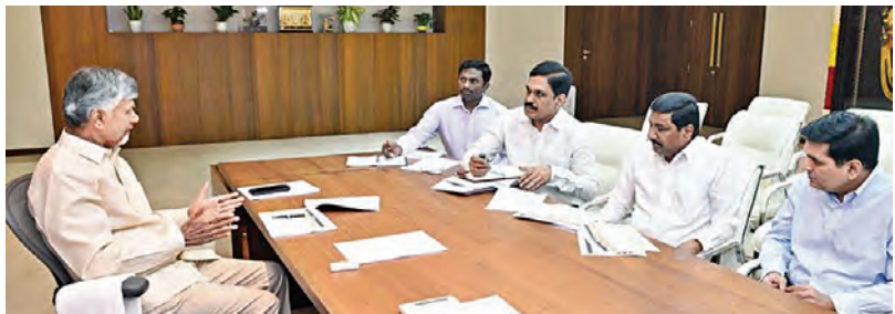
బుధవారం రాష్ట్ర జాతీయ రహదారుల ప్రాజెక్టులపై సమీక్షిస్తున్న సీఎం చంద్రబాబు