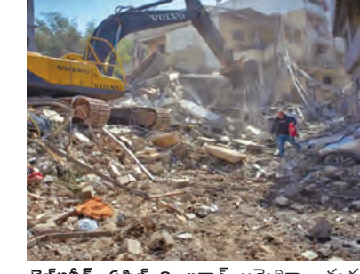
ఇరాన్ సేషన్ల సెక్యూరిటీ కౌన్సిల్ ఖండించినది అంతర్జాతీయ మీడియా కూడా వెల్లడించింది. 'కొన్ని గంటలపైగా లెబనాన్లో కాబులు ఆపకపోతే.. టెర్రోరిస్ట్(ఇజ్రాయెల్)లో బాంబుల మోత మోగతుంది' అని హెచ్చరించినట్లు వెల్లడించాయి. కాబుల విరమణపై నెలకొన్న అనిశ్చితే ఇరువర్గాల ప్రకటనలకు కారణం. లెబనాన్లోని హెచ్చరికలు గ్రూప్ ఇప్పటికే కాబుల విరమణకు అనుకూలంగా సంతకాలు పంపింది. కానీ ఇజ్రాయెల్ స్పందన భిన్నంగా ఉంది. ఈ సీక్ ఫైర్ లో లెబనాన్ కూడా భాగమని మధ్య వర్తించిన పాకిస్తాన్ ప్రకటించింది. అమెరికాలో కుదిరిన ఒప్పందంలో అయినా లెబనాన్లో కాబుల అలానే క్షాణ్ ఇరాన్ కోరుకుంది. కానీ ఇజ్రాయెల్ దానిని వ్యతిరేకిస్తోంది.

టెర్రోరిస్ట్, ఏప్రిల్ 8: ఇరాన్-అమెరికా మధ్య కుదిరిన కాబుల విరమణకు అంగీకారం కానీ.. లెబనాన్పై మాత్రం దాడులు ఆపకపోవడం ఇజ్రాయెల్ ప్రధాని బెంజమిన్ నెతన్యూవల ఇప్పటికే ప్రకటించారు. అయితే ఈ ప్రకటనలు