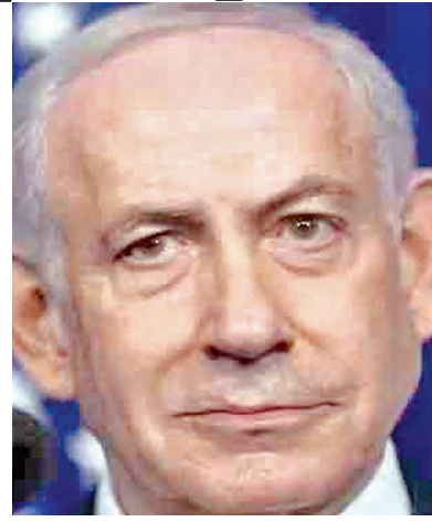
అక్కడి ప్రజలందరూ నగరం నుంచి తరలి వెళ్లాలని సూచించింది. ఇప్పటిదాకా అటు ఇరాన్పై విరుచుకుపడుతూనే, ఇటు లెబనాన్పై కూడా ఇజ్రాయెల్ దాడి చేసింది. ఈ దాడులకు బదులుగా హెచ్చరికలు కూడా ఎదురు దాడికి దిగింది. కానీ, అమెరికాలో ఇప్పుడు కుదిరిన కాబుల ఒప్పందం ప్రకారం హెచ్చరికలు కూడా కాబుల విరమణ పాటిస్తున్నట్లు తెలుస్తోంది. మరోవైపు ఇరాన్ కూడా బుధ్ధవారం ఉదయం దుబాయ్, సౌదీ, కువైట్ వంటి గల్ఫ్ దేశాలపై కొన్ని క్షిపణుల్ని ప్రయోగించినట్లు సమాచారం అయితే, వాటిని రక్షణ వ్యవస్థలు అడ్డుకున్నట్లు ఆ దేశాలు ప్రకటించాయి.

టెర్రోరిస్ట్, ఏప్రిల్ 8: ఇరాన్ అమెరికా మధ్య కాబుల విరమణ ఒప్పందం కుదిరినప్పటికీ ఇజ్రాయెల్-ఇరాన్ మధ్య ఉద్రిక్తతలు ఇంకా తగ్గినట్లు కనిపించడం లేదు. ఈ ఒప్పందాన్ని స్వాగతించిన ఇజ్రాయెల్ ఇది లెబనాన్కు మాత్రం వర్తించదని చెప్పింది. దక్షిణ లెబనాన్పై ఇజ్రాయెల్ దాడులు చేస్తూనే ఉంది. దీనిపై ఇరాన్ స్పందించింది. లెబనాన్పై దాడులు ఆపకుంటే ఇజ్రాయెల్పై తాము కూడా దాడులు చేస్తామని ఇరాన్ హెచ్చరించింది. ఈ మేరకు ఇరాన్ యన్ సేషన్ల సెక్యూరిటీ కౌన్సిల్ బుధ్ధవారం ఒక ప్రకటన విడుదల చేసింది. ముఖ్యంగా గంటల్లోగా దక్షిణ లెబనాన్పై దాడులు ఆపకపోతే మేం ఇజ్రాయెల్పై వైమానిక, క్షిపణి దాడులు చేస్తామని హెచ్చరించింది. అమెరికాలో కుదిరిన కాబుల ఒప్పందం ఒప్పందంలో ఇరాన్ తమతోపాటు లెబనాన్ వంటి తమ మిత్ర దేశాలపై కూడా పౌరులకు రాయబార కార్యాలయంలో సమన్వయం చేసుకుని, అది సూచించిన మార్గాలను ఉపయోగించి వీలైనంత త్వరగా ఇరాన్ ను విడిచి వెళ్లాలని సూచించింది. రాయబార కార్యాలయంలో ముందస్తు సంప్రదింపులు, సమన్వయం లేకుండా ఏ అంతర్జాతీయ భూ సరిహద్దును సమీపించడానికి ప్రయత్నించవద్దని పౌరులందరినీ సూచించింది. భారత రాయబార కార్యాలయం పేర్కొంది. ఈ సలహాలో, రాయబార కార్యాలయం తన పౌరుల కోసం అత్యవసర సంబంధన అందుబాటులో ఉంది.