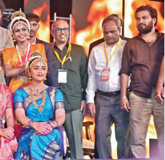
బుధవారం విశాఖ ఆయిల్లో జరిగిన సాంస్కృతిక కళాకారులతో డి.సిఎం పవన్

నిర్వహించామన్నారు. ప్రజల సమస్యలను పట్టించుకునే పరిస్థితి లేదని అన్నారు. మొత్తంగా రాష్ట్రంలో అవినీతి, అక్రమాలు పెరిగిపోయాయని, ప్రజలకు న్యాయం చేయాల్సిన బాధ్యతను ప్రభుత్వం విస్మరించిందని జగన్ తీవ్ర విమర్శలు చేశారు. వచ్చే ఏడాది తాను పాదయాత్ర ప్రారంభిస్తానని, అప్పుడి సువి చంద్రబాబుకు ప్రతిరోజూ తామెంటో చూపిస్తామని జగన్ హెచ్చరించారు. గత ప్రభుత్వంలో తాము చేసిన అప్పుల్లో మెజారిటీ వారి (రూ.2.73 లక్షల కోట్లు) నేరుగా డిడి బిల్లు ద్వారా ప్రజల ఖాతాల్లోకి చేరిందని తెలిపారు. చంద్రబాబు ఈ రెండిల్లోనే రూ.3.52 లక్షల కోట్లు అప్పు చేశారని, ఈ నిధుల్ని ఎవరి జేబుల్లోకి వెళ్తున్నాయో అయిన ప్రశ్నించారు. ఎన్నికల ముందు ప్రకటించిన సూపర్ సిక్స్, సూపర్ సెవెన్ హోమీలు చెల్లుబాటులోకి వెళ్తాయని, గ్రామీణ ఆర్థిక వ్యవస్థను ప్రభుత్వం నాశనం చేసేందని విమర్శించారు. గత ప్రభుత్వం ఆందించిన సంక్షేమ పథకాలను రద్దు చేస్తూ రాష్ట్ర ప్రతినిధి తిరోగమనంలోకి నెట్టారని జగన్ ఆవేదన వ్యక్తం చేశారు. రాజ్ కేంద్రం ప్రజల పక్షాన పోరాటాన్ని ఉధృతం చేస్తామని కేరక కుడి నినాదం చేశారు.