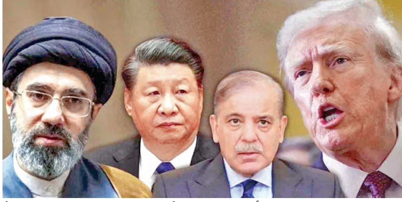
ప్రాంతభ్రమణనుప్పటి నుండి, చైనా శాంతిని ప్రోత్సహించడానికి, శత్రుత్వాలను నివారించడానికి చురుకుగా కృషి చేస్తోంది అన్నారు. కాబుల విరమణకు అంగీకరించడానికి ఇరాన్కు చైనా

చెంబో, ఏప్రిల్ 8: అమెరికా, ఇరాన్ల మధ్య 40వ రోజుకు చేరిన యుద్ధ జ్వాలలు ఎట్టకేలకు చల్లారాయి. ఇరాన్పై జరిపే భారీ సైనిక దాడుల నుంచి ట్రంప్ వెనక్కి తగ్గి, రెండు వారాల పరతులతో కూడిన కాబుల విరమణను ప్రకటించారు. ఈ నిర్ణయానికి, హార్డుకోట్ జలసంధిని తిరిగి తెరవడానికి మార్గం సుగమం అయ్యింది. ఈ ప్రకటన ప్రపంచవ్యాప్తంగా ఉత్సాహాన్ని కలిగించింది. ఈ కాబుల విరమణకు పాకిస్తాన్ ప్రధాని షాబాజ్ షరీఫ్, ఫిట్ మార్కెట్ అసెమ్ మునీర్ క్రెడిట్ తీసుకుంటున్నారు. కాబుల విరమణకు అంగీకరించేలా ఇరాన్ ను ఒప్పించడంలో చైనా కీలక పాత్ర పోషించింది. అమెరికా అధ్యక్షుడు డొనాల్డ్ ట్రంప్ నిర్ణయాన్ని దీనిని ప్రకటించారు. చైనా విదేశాంగ మంత్రిత్వ శాఖ ప్రతినిధి మాజీ సీనియర్ బుధ్ధవారం మీడియా సమావేశంలో మాట్లాడుతూ, ఇరాన్ వివాదం