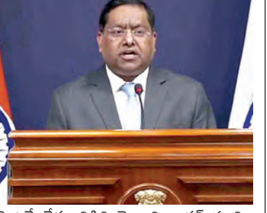
వెంటనే దేశం విడిచి వెళ్లాలని భారత్ సూచించింది. ఇరాన్లోని తమ రాయబార కార్యాలయం అందించిన మార్గాలను ఉపయోగించి మహానగరం భారత్ తన పౌరులకు సలహా ఇచ్చింది. టెక్నోలోని భారత రాయబార కార్యాలయం బుధ్ధవారం ఒక సలహాలో పేర్కొంది, ఏప్రిల్ 7నాటి సలహాలో కొనసాగుతూ ఇటీవలి పరిణామాలు దృష్ట్యా, ఇరాన్లో ఉన్న భారత పౌరులకు సలహా ఇచ్చింది. ఆది సూచించిన మార్గాలను ఉపయోగించి వీలైనంత త్వరగా ఇరాన్ ను విడిచి వెళ్లాలని సూచించింది. రాయబార కార్యాలయంలో ముందస్తు సంప్రదింపులు, సమన్వయం లేకుండా ఏ అంతర్జాతీయ భూ సరిహద్దును సమీపించడానికి ప్రయత్నించవద్దని పౌరులందరినీ సూచించింది. భారత రాయబార కార్యాలయం పేర్కొంది. ఈ సలహాలో, రాయబార కార్యాలయం తన పౌరుల కోసం అత్యవసర సంబంధన అందుబాటులో ఉంది.

న్యూఢిల్లీ, ఏప్రిల్ 8: అమెరికా-ఇరాన్ సంఘర్షణలో కాబుల విరమణ ప్రకటనపై భారత ప్రభుత్వం తోలిసారే స్పందించింది. బుధ్ధవారం విదేశాంగ మంత్రిత్వ శాఖ కాబుల విరమణను స్వాగతించి ఒక ప్రకటనను జారీ చేసింది. ఈ కాబుల విరమణ వశ్యమ అనియతలో శాశ్వత శాంతిని నెలకొల్పటానికి ఆసక్తికరమైన ముందాని మొదటి నుంచి వాదిస్తోంది. విదేశాంగ ప్రతినిధి రజదీప్ జైస్వాల్ వ్యాఖ్యానించారు. ప్రస్తుత సంఘర్షణకు త్వరితగతిన ముగింపు పలకడానికి ఉద్దేశ్యాలను తగినవరకు అత్యవసరమని, శాంతిని నెలకొల్పడానికి చర్యలు, డౌబియస్ కీలకమని మేము నిరంతరం చెబుతూనే ఉన్నామని ఆ అయన అన్నారు. నెల రోజులకు పైగా కొనసాగుతున్న అమెరికా-ఇరాన్ల మధ్య ఘర్షణ పల్ల జరిగిన నష్టంపై విదేశాంగ మంత్రిత్వ శాఖ తన ప్రకటనలో ఆందోళన వ్యక్తం చేసింది. ఈ ఘర్షణ ప్రపంచవ్యాప్తంగా అధిక సంఘర్షణలకు, వాణిజ్య నిలిపివేతలకు అంతరాయం కలిగించింది. పౌరులకు తీవ్ర ఇబ్బందులు కలిగించింది మంత్రిత్వ శాఖ వెల్లడించింది. హార్డుకోట్ జలసంధి ద్వారా ఇంధన సరఫరా, ప్రపంచ వాణిజ్యం ఇకపై కొనసాగుతాయని ఆసక్తికరమైనట్లు తెలిపారు. తక్షణమే ఇరాన్ విడిచి వెళ్లండి: మరోవైపు, తక్షణమే ఇరాన్ ప్రకటన అనంతరం, ఇరాన్లో చిక్కుకుపోయిన తమ పౌరులు