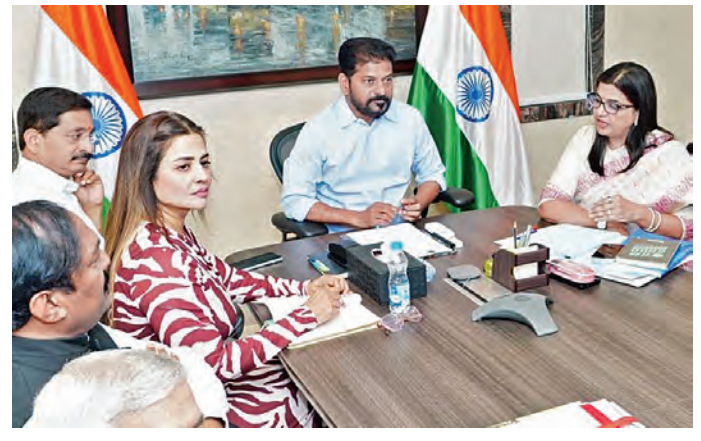
బుధవారం హైదరాబాద్ లో పలు కంపెనీల ప్రతినిధులతో సమావేశమైన ముఖ్యమంత్రి రేవంత్ రెడ్డి

హైదరాబాద్, ఏప్రిల్ 8, ప్రభాతవార్త: నిజామాబాద్ జిల్లాలో మరో భారీ సైబర్ మోసం వెలుగు చూసింది. గతదిన ఏడాది కాలంగా ఈ జిల్లాలో మ్యూల్ ఫాతాల సహకారంతో విడిశాలలో వుండే బడా సైబర్ నేరగాళ్లు పదుల కోట్ల రూపాయలను కొల్లగొట్టడం తెలిసింది. వీరికి సహకరించిన మ్యూల్ ఫాతాదారులను పోలీసులు అరెస్టు చేయడం విడితమే. తాజాగా ఇటువంటిదే మరో గోల్డెన్ బాగోతం రట్టయ్యింది. కేవలం మూడు నెలల వ్యవధిలో తొమ్మిది మ్యూల్ ఫాతాల ద్వారా 152 కోట్ల రూపాయలను సైబర్ నేరగాళ్లు కొట్టారు. >>2