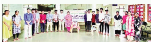
అశ్వారావుపేట రూరల్, ఏప్రిల్ 11 ప్రభాతవార్త: