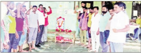
దమ్మపేట, ఏప్రిల్ 11 ప్రభాతవార్త: