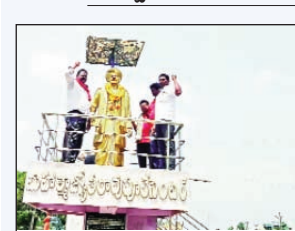
అశ్వారావుపేట రూరల్, ఏప్రిల్ 11 ప్రభాతవార్త: