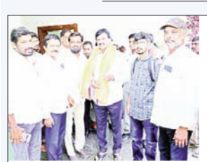
దమ్మపేట, ఏప్రిల్ 11 ప్రభాతవార్త: