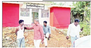
దమ్మపేట, ఏప్రిల్ 11 ప్రభాతవార్త:

నాగుపల్లి గ్రామంలో కేరళ మోడల్తో నిర్మిస్తున్న నూతన అంగన్వాడీ భవనాన్ని ఎమ్మెల్యే జారె ఆదినారాయణ శనివారం పరిశీలించారు, పనుల నిర్మాణ పనుల పురోగతిని సమీక్షించి పనులు నాణ్యతతో వేగవంతంగా పూర్తి చేయాలని అధికారులకు సూచించారు. ఈ కార్యక్రమంలో పలువురు కాంగ్రెస్ నాయకులు పాల్గొన్నారు. నేడు నియోజకవర్గం బిఎలవలతో ఎమ్మెల్యే సమావేశం: అశ్వారావుపేట నియోజకవర్గం ఎమ్మెల్యే జారె ఆదినారాయణ అధ్యక్షతన నేడు అనగా ఆదివారం ఉదయం 10 గంటలకు మండలంలోని గండుగులపల్లి ఎమ్మెల్యే క్యాంప్ కార్యాలయంలో నియోజకవర్గంలోని నూతనంగా ఎన్నుకోబడిన మన కాంగ్రెస్ పార్టీ 184 బూత్ల బూత్ లెవల్ ఎజెంట్లతో సమావేశం జరుగుతుంది అన్నారు. ఈ సమావేశానికి భద్రాద్రి కొత్తగూడెం జిల్లా కాంగ్రెస్ పార్టీ అధ్యక్షులు తోట దేవిప్రసన్న, తెలంగాణ రాష్ట్ర పీసీసీ జనరల్ సెక్రటరీ షబ్బీర్ అలీ ముఖ్య అతిథులుగా పాల్గొంటారని కావున 5 మండల నాయకులు, మండల అధ్యక్షులు, మహిళా అధ్యక్షులు, యూత్ అధ్యక్షులు పాల్గొనాలని కోరారు.