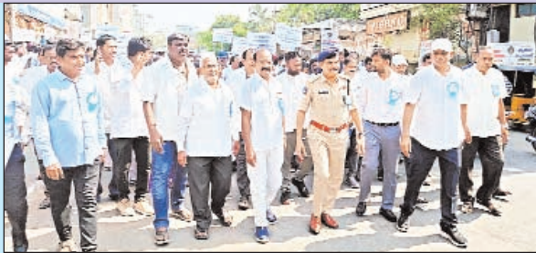
ఖమ్మం టౌన్ ప్రభుత్వ వార్త ఏప్రిల్ 11:

ప్రజా పాలన - ప్రగతి ప్రణాళికలో భాగంగా ఖమ్మం జిల్లాలో డ్రగ్స్ రహిత సమాజం లక్ష్యంగా శనివారం ఒక భారీ అవగాహన ర్యాలీ నిర్వహించారు. ఈ ర్యాలీ నగరంలోని కెమిస్ట్ భవన్, మయూరి సెంటర్ నుండి ప్రారంభమై పాత ఎల్.ఐ.సి. ఆఫీస్, శ్రీ సెంటర్ వరకు ప్రధాన వీధుల మీదుగా సాగింది. ఈ