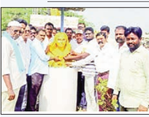
అశ్వారావుపేట అర్బన్, ఏప్రిల్ 11 ప్రభాతవార్త: