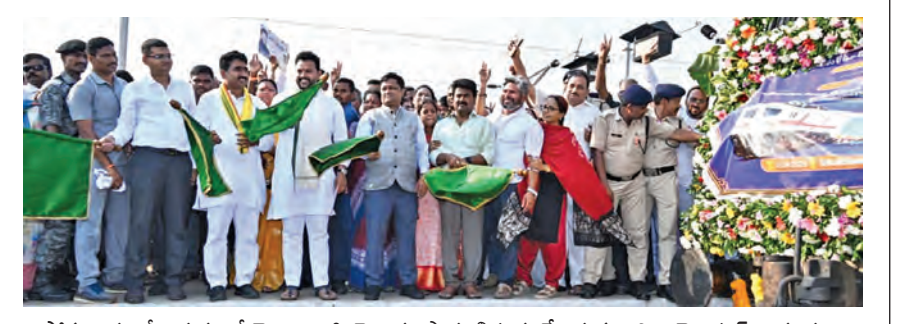
సోమవారం శ్రీకాకుళంలో జెండా ఊపి రైలును ప్రారంభిస్తున్న కేంద్ర మంత్రి రామ్మోహన్ నాయుడు