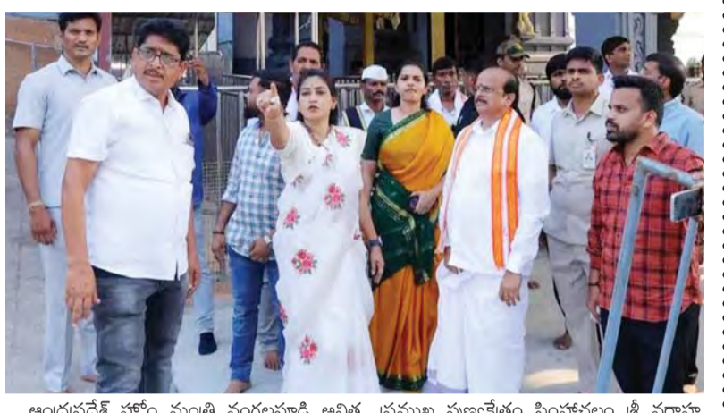
ఆంధ్రప్రదేశ్ హోం మంత్రి వంగలపూడి అనిత, ప్రముఖ పుణ్యక్షేత్రం సింహాచలం శ్రీ పరాశా లక్ష్మీమీ నరసింహ స్వామి వారిని సోమవారం దర్శించుకున్నారు. ఆలయానికి విచ్చేసిన మంత్రికి అధికారులు ఆలయ మర్యాదలతో ఘన స్వాగతం పలికారు. స్వామివారి దర్శనం అనంతరం ఆమెకు వేద పండితులు ఆశీర్వాదనం అందించారు. ఈ నెల 20న జరగనున్న స్వామివారి చందనోత్సవాన్ని పురస్కరించుకుని సింహగిరిపై జరుగుతున్న ఏర్పాట్లను మంత్రి సమీక్షించారు. భక్తులకు ఎలాంటి ఇబ్బందులు కలగకుండా అన్ని మోతీక వసతులు కల్పించాలని అధికారులకు మిగతా 8...లో