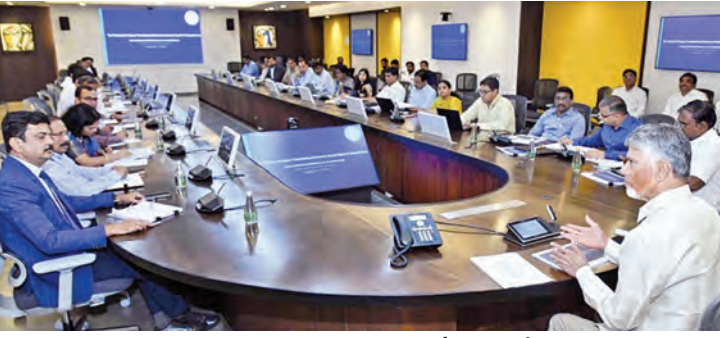
సోమవారం అమరావతిలో సీఎం చంద్రబాబుతో భేటీ అయిన స్టీల్ సెక్టర్ సందిమ్ బృందం

పారిశ్రామిక అనుమతులకు 800పైగా ఉన్న నిబంధనలు 100లోపు తగ్గించు వేధింపులులేని థర్డ్ పార్టీ తనిఖీలు అటవీ చట్టాలు సవరించాలని కేంద్ర బృందానికి సూచన స్టీల్ సెక్టర్ సందిమ్ పాండ్రిక్ బృందంతో సీఎం చంద్రబాబు భేటీ