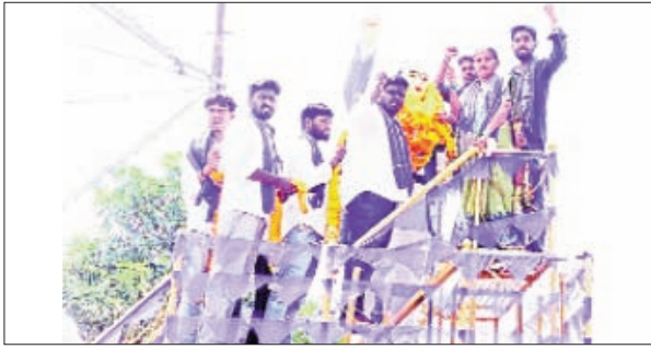
విద్య, హక్కులు, సామాజిక న్యాయం కోసం ఆయన చేసిన కృషి తరతరాలకు మార్గదర్శకమని పేర్కొన్నారు. యువత అంబేద్కర్ ఆలోచనలను ఆచరణలో పెట్టాలని, రాజ్యాంగ విలువలను కాపాడాలని పిలుపునిచ్చారు. కార్యక్రమం దేశభక్తి నినాదాలతో, అంబేద్కర్ జయంతి శుభాకాంక్షల మధ్య స్ఫూర్తిదాయక వాతావరణంలో ముగిసింది