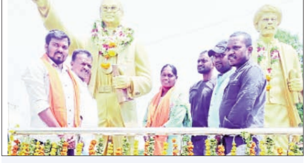
రామగిరి ప్రభాత వా