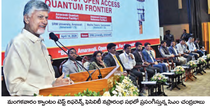
మంగళవారం క్యాంటం టెన్స్ లివ్ టెన్స్ ఫెసిలిటీ సమావేశం సభలో ప్రసంగిస్తున్న సీఎం చంద్రబాబు

విజయవాడ, ఏప్రిల్ 14: ప్రభావవంతమైనది: దేశంలోనే తొలి క్యాంటం ఫెసిలిటీ సెంటర్ అవిష్కరణ అమరావతిలో జరుగడం ఓ చారిత్రక తీరు. అద్భుతమైనది క్యాంటం నామం అన్నాడు. ప్రపంచ క్యాంటం దినోత్సవాన్ని సందర్భంగా క్యాంటం నూతన అధ్యాయం ఏపీలో అవిష్కరణమంది వ్యాఖ్యానించారు. దేశంలోనే తొలి క్యాంటం ఫెసిలిటీ సెంటర్ అను రావతిలో ముఖ్యమంత్రి చంద్రబాబు అవిష్కరించారు. మానవ వనరుల శాఖ మంత్రి నారా లోకేష్ సీఎం చంద్రబాబుకు ఈ కార్యక్రమంలో సహకరించారు. క్యాంటం టెన్స్ లివ్ టెన్స్ ఫెసిలిటీ కలిగిన తొలి రాష్ట్రంగా ఆంధ్రప్రదేశ్ అవతరించినది కొనియదారు. అమరావతిలోని ఎన్ఆర్ఎం యూనివర్సిటీ, గన్నవరంలోని మేధాబు వర్సెస్ ఏర్పాటు చేసిన టెన్స్ టెన్స్ సీఎం జాతీయ లెవెల్ చేశారు. ఎన్ఆర్ఎం వర్సెస్ కార్యక్రమంలో ముఖ్యమంత్రి పాల్గొన్నారు. ఎన్ఆర్ఎం నుంచి మేధాబు వర్సెస్ లోని టెన్స్ టెన్స్ వర్సెస్ గా సీఎం ప్రారంభించారు. ఎన్ఆర్ఎం యూనివర్సిటీ, గన్నవరం