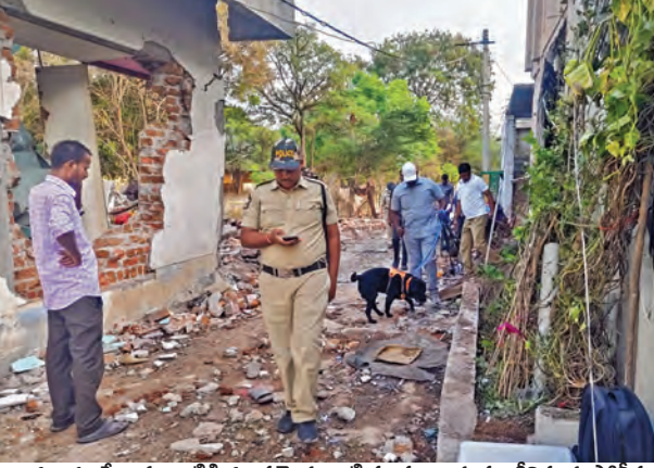
బుధవారం పేలుడు ధాటికి ధ్వంసమైన ఇంటి పరిసరాలను పరిశీలిస్తున్న పోలీసులు