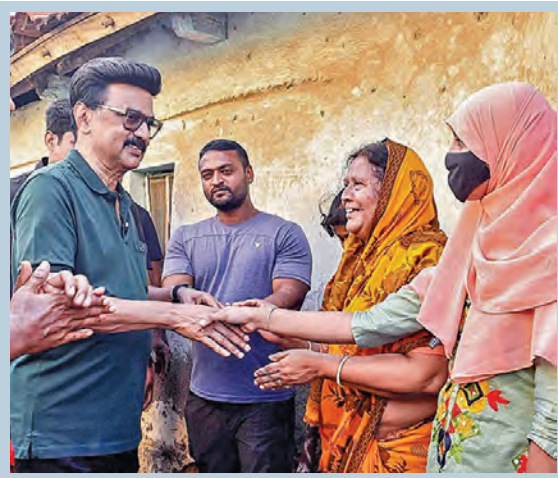
ధర్మపురిలో బుధవారం ఎన్నికల ప్రచారం నిర్వహిస్తున్న తమిళ సిఎం స్టాల్స్