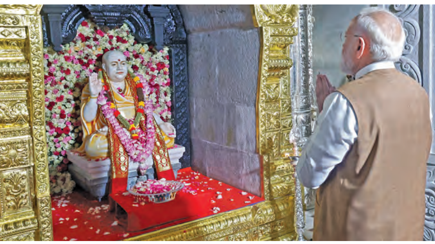
బుధవారం కర్ణాటకలోని మాండ్య జిల్లా శ్రీ క్షేత్ర ఆదిమంచనగిరిలో శ్రీ గురుభైరవైశ్వర మందిరంలో ప్రత్యేక పూజలు చేస్తున్న ప్రధాని మోడీ

>>> బిల్లును కేంద్రం తీసుకొస్తున్న విధానంలోనే మాకు అభ్యంతరాలున్నాయి. ఈ బిల్లు రాజకీయ ప్రేరేపితమైందిగా కనిపిస్తోంది. ప్రతిపక్షాల్ని అణచివేసేందుకే కేంద్రం ఈ పని చేస్తోంది. అయినప్పటికీ మేం ఈ బిల్లును మద్దతు ఇస్తూ వస్తున్నాం. కానీ, గతంలో చేసిన మార్పుల్ని అమలు చేయాలని కోరాం. డి లిమిటేషన్ అంశంలో కూడా కేంద్రం కొన్ని మెలికలు పెడుతోంది. ఈ అంశంపై అన్ని పార్టీలు పార్లమెంట్ లో పోరాడుతాయి. డిలిమిటేషన్ బిల్లును వ్యతిరేకిస్తాం. కానీ, మహిళా రిజర్వేషన్ బిల్లుకు మద్దతిస్తాం. డిలిమిటేషన్ ను సంబంధించి జనాభా గణన అంశంపై స్పష్టత లేదు. రాజ్యాంగంలోని అన్ని హక్కుల్ని తీసుకుకుంటామని. ఇప్పటికే ఆసాం, జమ్మూ కాశ్మీర్ లో ఈ విషయంలో మోసం చేశారు. ప్రతిపక్షంగా మేం ఇక్కడ ఉన్నాం" అని ఖర్గే వ్యాఖ్యానించారు.