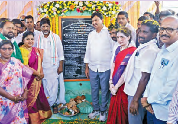
బుధవారం సత్పత్తి మండలంలో పలు అభివృద్ధి పనులకు శంకుస్థాపన చేస్తున్న డి.సిఎం భట్టి, చిత్రంలో మంత్రి పొంగులేటి తదితరులు