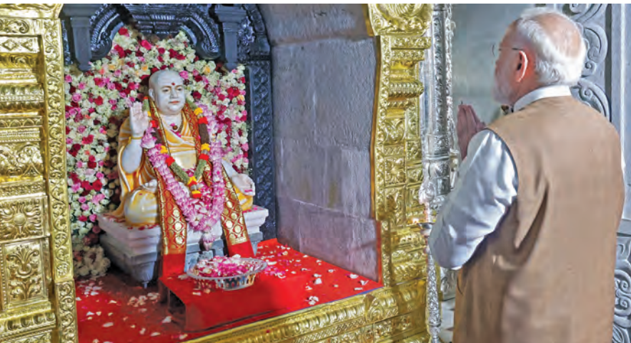
బుధవారం కర్ణాటకలోని మాండ్య జిల్లా శ్రీ క్షేత్ర ఆదిమంచనగిరిలో శ్రీ గురుభైరవైశ్వమందిరంలో ప్రత్యేక పూజలు చేస్తున్న ప్రధాని మోడీ

>>> బిల్లును కేంద్రం తీసుకొస్తున్న విధానంలోనే మాకు అభ్యంతరాలున్నాయి. ఈ బిల్లు రాజకీయ ప్రేరేపితమైందిగా కనిపిస్తోంది. ప్రతిపక్షాల్ని అణచివేసేందుకే కేంద్రం ఈ పని చేస్తోంది. అయినప్పటికీ మేం ఈ బిల్లును మద్దతు ఇస్తూ వస్తున్నాం. కానీ, గతంలో చేసిన మార్పుల్ని అమలు చేయాలని కోరాం. ఢిల్లీలోని బీజెపి అంశంలో కూడా కేంద్రం కొన్ని మెలికలు పెడుతోంది. ఈ అంశంపై అన్ని పార్టీలు పార్లమెంట్ లో పోరాడుతాయి. ఢిల్లీలోని బిల్లును వ్యతిరేకిస్తాం. కానీ, మహిళా రిజర్వేషన్ బిల్లుకు మద్దతిస్తాం. ఢిల్లీలోని బీజెపి నుండి సంబంధించి జనాభా గణన అంశంపై స్పష్టత లేదు. రాజ్యాంగంలోని అన్ని హక్కుల్ని తీసుకుంటున్నాం. ఇప్పటికే అసెంబ్లీ, జమ్మూ కాశ్మీర్ లో ఈ విషయంలో మోసం చేశారు. ప్రతిపక్షంగా మేం ఇక్కడ ఉన్నాం" అని ఖర్గే వ్యాఖ్యానించారు.