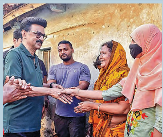
ధర్మపురిలో బుధవారం ఎన్నికల ప్రచారం నిర్వహిస్తున్న తమిళ సిఎం స్టాల్స్