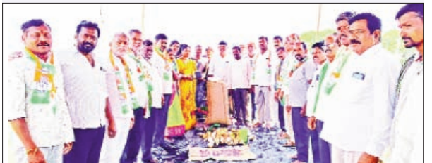
తరిగొప్పుల, ఏప్రిల్ 15 ప్రభాతవార్త: