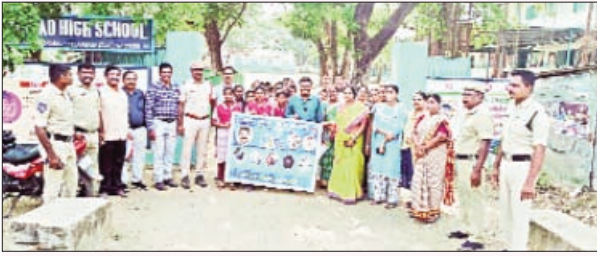
దుగ్గండి, ఏప్రిల్ 15, ప్రభాతవార్త