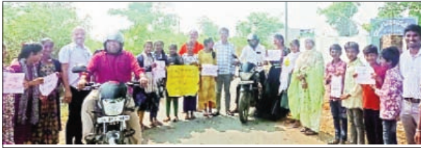
చెన్నారావుపేట, ఏప్రిల్ 15, ప్రభాతవార్త