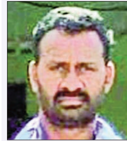
దేవరపల్లె, ఏప్రిల్ 15 ప్రభాతవార్త :