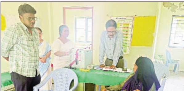
దుగ్గండి, ఏప్రిల్ 15, ప్రభాతవార్త