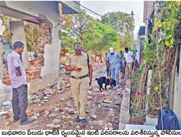
బుధవారం పిలుడు ధాటికి డ్యూంసమైన ఇంటి వలసలను పరిశీలిస్తున్న పోలీసులు