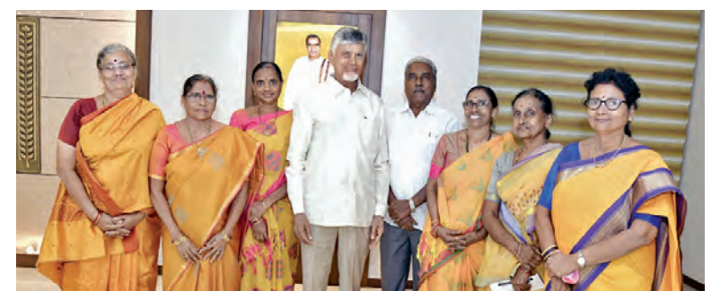
గుడివాడకు చెందిన శ్రీ సాయి సత్కారం సభ్యులతో సీఎం చంద్రబాబు