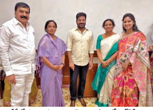
డీజిల్లో మర్యాద పూర్వకంగా తెలంగాణ సీఎం రేచంకెరెడ్డిని కలిసిన ఎం ఎమ్మెల్యే ఎంబిలు

రాజకీయ పార్టీల మధ్య కూడగట్టి బిల్లును ప్రధాని నరేంద్ర మోడీ నాయకత్వంలోని కేంద్ర ప్రభుత్వం దేశంలో మహిళా సాధికారత సాధించడమే లక్ష్యంగా మహిళా రిజర్వేషన్ బిల్లు సవరణ బిల్లును పార్లమెంట్లో ప్రవేశపెట్టినందున అందరి మధ్యలో ఈ బిల్లు ఆమోదం పొందడం తాయిమని కేంద్ర ఉమ్మడి భారీ పరిశ్రమల శాఖ సహాయమంత్రి భూపతిరాజు శ్రీనివాస పర్యటిమా వ్యక్తం చేశారు. గురువారం పార్లమెంట్ ఆవరణలో మీడియాతో మాట్లాడిన ఆయన మహిళా రిజర్వేషన్ బిల్లు సవరణ బిల్లు మహిళల సామాజిక, రాజకీయ భవిష్యత్తును మార్చబోయే ఒక గొప్ప ముందడుగు అని అభిప్రాయపడ్డారు. 2023లోనే నారీ శక్తి చంద్ అభినియంను ఏకాగ్రప్రాయంతో ఆమోదించామని గుర్తుచేశారు. దాని అమలు విషయంలో ఉన్న స్తబ్ధతను ప్రధాని మోడీ తొలగించారని శ్రీనివాస పర్యటిమా పేర్కొన్నారు. ఈ 33 రిజర్వేషన్ కోసం 2033 వరకు వేటి చూడాలని ఆయనకు లేకుండా, 2029 నుంచే అమలు చేసే విధంగా కేంద్ర ప్రభుత్వం పారిశ్రామిక నిర్ణయం తీసుకుంది అయిన వెల్లడించారు. ఈ విషయంలో అన్ని