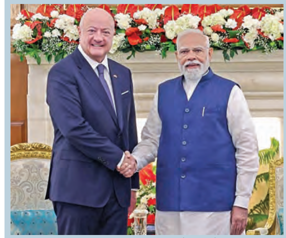
గురువారం న్యూఢిల్లీలో ప్రధాని మోడీతో భేటీ అయిన ఆఫ్రియా ఛాన్సలర్ క్రిస్టియన్ స్ట్రాచర్