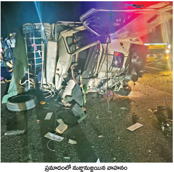
ప్రమాదంలో సుజ్జనుజ్జను వాహనం

దైవదర్శనానికి వెళ్తూ పరలోకాలకు.. మంత్రాలయం వద్ద ఘోర ప్రమాదం బొటెరోను ఢీకొన్న సిమెంటు లారీ 8మంది మృతి, పలువురికి తీవ్రగాయాలు రాష్ట్రపతి, ప్రధాని దిగ్భ్రాంతి మంత్రాలయం, ఏప్రిల్ 16, ప్రభాతవార్త: మంత్రాలయం మండలం బిలకలడోన్ గ్రామం దాటిన తర్వాత మలుపు వద్ద గురువారం తెల్లవారుజామున 3:30 గంటల సమయంలో జరిగిన ఘోర రోడ్డు ప్రమాదంలో 8 మంది మృతి చెందగా, 9మంది తీవ్రంగా గాయపడిన ఘటన చోటు చేసుకుంది. బోటి సులు తెలిసిన వివరాలు ఇలా ఉన్నాయి. కర్ణాటక రాష్ట్రం బిక్కమంగళూరు పట్టణ సమీపంలోని ఊడేవ గ్రామం, కణాయకసహాల్ గ్రామానికి చెందిన 21 మంది భక్తులు మంత్రాలయం కాఫెటెర్మాను దర్శనార్థమై కేపీ46 9745నంబర్ గల బోలెలో గూడ్స్ వాహనంలో బయలుదేరారు. గురువారం తెల్లవారుజామున 3:30గంటల సమయంలో మంత్రాలయం మండలం బిలకలడోన్ గ్రామం దాటిన తర్వాత మలుపు వద్ద బోలెలో వాహనం డ్రైవర్ నిద్రమత్తులో ఎదురుగా మంత్రాలయం వైపు నుంచి వస్తున్న సిమెంట్ లోడి >>2