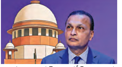
బ్యాంకులు రిలయన్స్ ఇండస్ట్రీస్ ఖాతాలను మోసపూరితమైనవిగా ప్రకటించాయి. బ్యాంకులు చేసిన ప్రకటనపై అనిల్ అంబానీ బాంబే హైకోర్టులో సవాల్ చేశారు. విచారించిన హైకోర్టు సింగిల్ బెంట్, వాటిపై స్టే విధించడంతో పాటు భవిష్యత్తులో చర్చలు నిలిపివేయాలని ఆదేశాలు ఇచ్చింది. మోసపూరిత ఖాతాలు గుర్తించే విషయంలో ఆర్డీలు మార్చడంపై పాటింపలేదని పేర్కొంది. దీనితో మూడు బ్యాంకులు అప్పీలుకు వెళ్లాయి. విచారించిన హైకోర్టు డివిజన్ బెంట్, సింగిల్ బెంట్ ఉత్తర్వులను కొట్టివేసింది.

న్యూఢిల్లీ, ఏప్రిల్ 16: రిలయన్స్ కమ్యూనికేషన్స్ గ్రూపు కంపెనీల రుణ ఖాతాలను మోసపూరితమైనవిగా పేర్కొన్నామని సవాల్ చేస్తూ పాలిటా మిశ్రిత అనిల్ అంబానీ దాఖలు చేసిన పిటిషన్ ను విచారించేందుకు సుప్రీంకోర్టు నిరాకరించింది. రిలయన్స్ కమ్యూనికేషన్స్ కు చెందిన మోసపూరిత ఖాతాల విషయంలో చర్చలకు బాంబే హైకోర్టు అనుమతించామని ఆయన సవాల్ చేయగా, సుప్రీంకోర్టులో చుక్కెదురైంది. ఈ మేరకు సుప్రీంకోర్టు ప్రధాన న్యాయమూర్తి జస్టిస్ సూర్యకాంత్ నేతృత్వంలోని త్రిసభ్య ధర్మాసనం తన నిర్ణయాన్ని ప్రకటించింది. అయితే బ్యాంకులిచ్చిన షోజ్ నోటీసులపై హైకోర్టు సింగిల్ జడ్జి బెంట్ వద్ద తన వాదనలు వినిపింపజేసామని అనిల్ అంబానీకి అనుమతించింది. ఈ ప్రక్రియను వేగంగా పూర్తి చేయాలని హైకోర్టు సూచించింది. బ్యాంక్ ఆఫ్ బరోడా, ఇండియన్ ఓపెన్ బ్యాంకు, ఇడిఐఐ