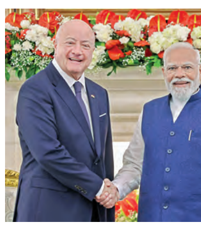
ఉద్రిక్త పరిస్థితులు కనిపిస్తున్నాయని అన్నారు. ఈ యుద్ధం ప్రభావం ప్రజల జీవన విధానంపై పడుతోందని అన్నారు. ఉక్రెయిన్ లేదా పశ్చిమాసియా ఏదైనా సమస్య శాస్త్రవేత్తల