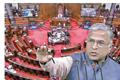
చర్చలు జరిగాయి. అయితే, లోకసభ ఉపసభాపతి పదవి 2019 నుండి ఖాళీగా ఉన్నప్పటికీ, ఈ పదవిని భర్తీ చేయడానికి ఎన్నికలు నిర్వహించడంలో అధికార పక్షం చూపుతున్న "అభ్యుత్థాపన" వట్ల కాంగ్రెస్, టిఎంసీ, వామపక్ష పార్టీలు ఆభ్యంతరాలు వ్యక్తం చేశాయి. ఈ సేవభ్యంతోనే రాజ్యసభ డిప్యూటీ చైర్మన్ ఎన్నికలను నిర్వహించాలని డిమాండ్ చేశారు. ఈ సేవభ్యంతోనే రాజ్యసభ డిప్యూటీ చైర్మన్ ఎన్నికలను నిర్వహించాలని డిమాండ్ చేశారు. ఈ సేవభ్యంతోనే రాజ్యసభ డిప్యూటీ చైర్మన్ ఎన్నికలను నిర్వహించాలని డిమాండ్ చేశారు.

ఎన్డియే అభ్యర్థిగా హరివంశ్ ఏకాభిప్రాయ సాధన కోసం జెఐ నడ్డా వివక్షలతో చర్చలు ఎన్నిక బహిష్కరించాలని ఇండియా కూటమి నిర్ణయం