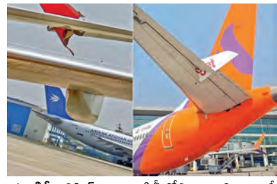
న్యూఢిల్లీ, ఏప్రిల్ 16: ఢిల్లీలోని ఇందిరాగాంధీ అంతర్జాతీయ విమానాశ్రయంలో గురువారం సాయంత్రం పెను ప్రమాదం త్వరితగతినైంది. ట్యాక్సీ వేపు ఆకాశం ఎయిర్, సైనికబలం తోడ్పడ్డాయి. ఈ ఘటనలో ప్రయాణీకులు, సిబ్బంది తండ్రి అగు బయరపడటంతో