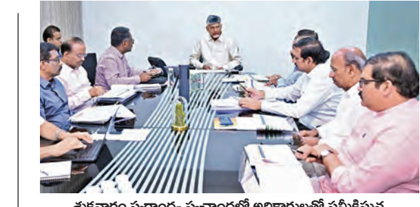
శుక్రవారం స్వచ్ఛంద-స్వచ్ఛాంద్రలో అధికారులతో సమీక్షిస్తున్న ముఖ్యమంత్రి చంద్రబాబు నాయుడు