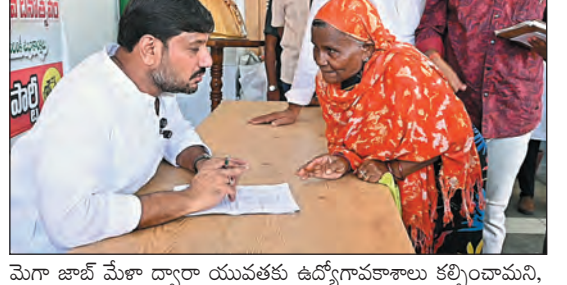
మోగా జాబ్ మేళా ద్వారా యువతకు ఉద్యోగవకాశాలు కల్పించామని, ఇంటికి పారిశ్రామికవేత్తల తయారు చేయాలనే సంకల్పంతో పని చేస్తున్నామని చెప్పారు. ఏ సమస్య వచ్చినా గుంటూరు తూర్పు నియోజకవర్గ ప్రజలకు 24 గంటలు అందుబాటులో ఉంటానని హామీ ఇచ్చారు.