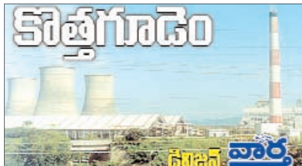
చుంచుపల్లి, జూలూరుపాడు, సుజాతనగర్

అభిమానులు, బీఆర్ఎస్ నాయకులు, కార్యకర్తలు అధిక సంఖ్యలో పాల్గొని విజయవంతం చేయాలని ఆయన విజ్ఞప్తి చేశారు.