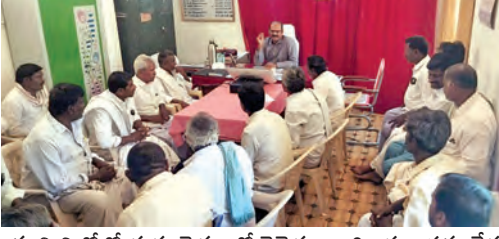
భూమిని కోల్పోతున్న రైతులతో రెవెన్యూ అధికారుల సమావేశం నిర్వహించిన ధరలే చెల్లినారా అనే అయోమయం అన్నదాతలను చుట్టుముడుతోంది.

ఊడపటి, ఏప్రిల్ 19, ప్రభాతవార్త: తరతరాలుగా తమకు జీవనాధారంగా ఉన్న భూములను కమలపాడు పంపుడి స్టోరేజీ ప్రాజెక్టు (పిఎస్పావ్) కి భూసేకరణలో భాగంగా కోల్పోతున్న అన్నదాతల్లో అందోళన, సందిగ్ధత నెలకొంది. ఇప్పటికే గుడిపాడు, కమలపాడు, కుందనకోట రెవెన్యూ గ్రామాల పరిధిలో సాగర్ సిమెంట్స్ (పిఎంఎం), అదాని సిమెంట్స్ (పెన్నా) కర్మాగారాలకు పెద్ద ఎత్తున రైతుల భూములను కోల్పోయారు. ప్రస్తుతం ఈ పిఎస్పావ్ కోసం దాదాపు 264 మంది రైతులు 398 ఎకరాల పైగా వ్యవసాయ భూములను కోల్పోతున్నందున వ్యవసాయం ఆధారంగా జీవనం సాగిస్తున్న తమ భవిష్యత్తుపై, ప్రభుత్వం చెల్లించనున్న పరిహారంపై వారిలో సందిగ్ధత నెలకొంది. భూముల వారిగా భూసేకరణపై ప్రభుత్వం స్పష్టమైన ప్రకటన ఇచ్చినప్పటికీ తమ భూముల ధరలపై స్పష్టత కొరవడంతో అన్నదాతల్లో అందోళన నెలకొంది. జటీవల సమీప గ్రామాల్లో ఓ సిమెంట్ కర్మాగారం సేకరించిన ధరలే తమకు చెల్లినారా.. లేక ప్రభుత్వం