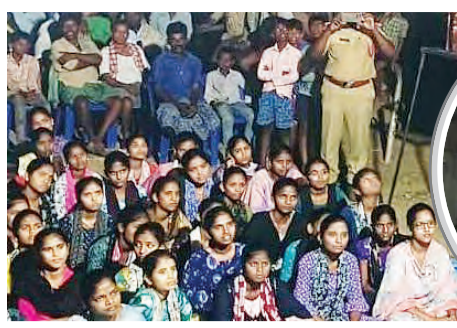
- బాల్యవివాహ నిర్మూలనకు ప్రతిఘటనకు కృషి చేయాలి మంత్రాలయం, ఏప్రిల్ 19, ప్రభాకర్ వార్య: