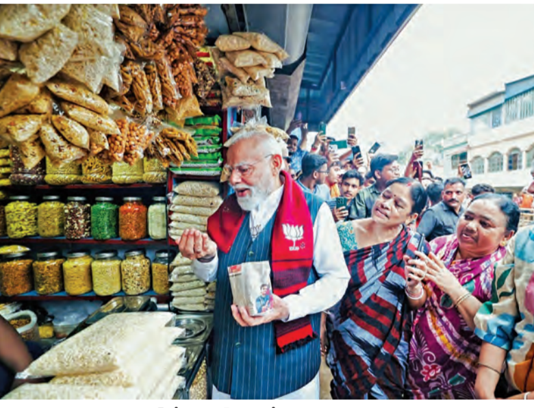
పశ్చిమ బెంగాల్ లోని రూర్ గ్రామంలో ఆదివారం ఎన్నికల ప్రచారం సందర్భంగా ఓ పాపులో మరమాలను కొని రుచి చూస్తున్న ప్రధాని మోడీ