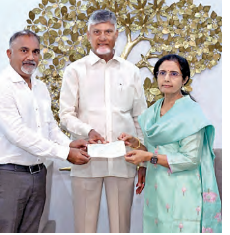
రూ.5 లకే కడుపునింపే అన్న క్యాంటీన్ల సేవలను మరింత విస్తరించాలి. నాణ్యతను పాటించడంతో పాటు పవిత్రంగా, గౌరవంగా, పరిశుభ్రంగా ఆహారం అందించే ఈ కార్యక్రమానికి దాతలు ముందుకు వచ్చి విరాళాలు ఇవ్వాలి. పుట్టిన రోజు, పెళ్లి రోజు సహా తమకు సచ్చిన రోజు భోజనాలకు అయ్యే ఖర్చును విరాళంగా ఇచ్చేందుకు ప్రజలు ముందుకు రావాలి. ఇదొక సూక్ష్మ దానకార్యమైన కావాలని కార్యక్రమం మారి బ్రాండ్ను సృష్టించాలి" అని చంద్రబాబు అన్నారు.

లక్షల ప్రతి ఏటా తిరుమలలో అన్న ప్రసాదానికి రూ.44 లక్షల విరాళంగా అన్న క్యాంటీన్లకు అన్నం పెట్టే అమ్మను తలపిస్తున్నారని భువనేశ్వరి అన్నారు. అత్యంత పరిశుభ్రమైన వాతావరణంలో అన్న క్యాంటీన్లలో పాష్టికాహారం అందించడం గొప్ప విషయం అని ఆమె అభిప్రాయం వ్యక్తం చేశారు. రోజువారీ కూలీలు, పేదలు ఈ వత్తకు ద్వారా ఎంతో లబ్ధి పొందుతున్నారని, ఇలాంటి కార్యక్రమాలను ప్రతి ఒక్కరూ ప్రోత్సహించాలని కోరారు. అన్న క్యాంటీన్లకు ఆర్థికంగా చేయూతనిచ్చి సన్మాని నింపేందుకు అంతా ముందుకు రావాలని ఆమె విజయనిచ్చారు. ఆకలితో ఉన్న వారికి అన్నం పెట్టడం కంటే సంతోషి ఎముంటుందని వ్యాఖ్యానించిన భువనేశ్వరి, తాను పలు సందర్భాల్లో అన్న వితరణ కార్యక్రమంలో పాల్గొన్నప్పుడు కలిగిన సంతోషాన్ని, ప్రజల స్తుతినను ఈ సందర్భంగా గుర్తించుకోవాలని, తమ మనవడు దేవాన్ పుట్టిన రోజు సందర్భంగా 12