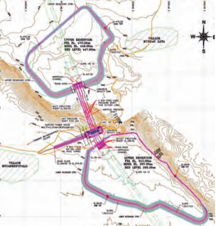
కమలపాడు వద్ద నిర్మించనున్న పంపుడ్ స్టోరేజీ ప్రాజెక్టు సమాచారం

● 398 ఎకరాల పట్టా భూములు కోల్పోనున్న 264 మంది రైతులు ● కమలపాడు వద్ద రూ.4,676.50 కోట్లతో 950 మెగావాట్ల పిఎస్హెచ్పి ఏర్పాటు