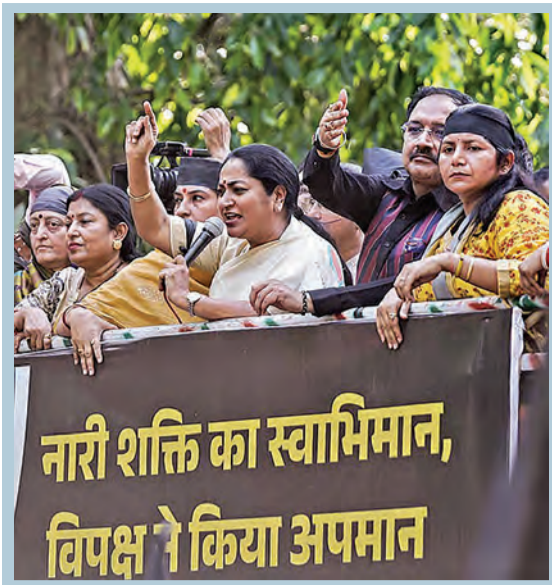
131వ రాష్ట్రాంగ సవరణ బిల్లుపై కాంగ్రెస్ వైఖరికి నిరసనగా రాహుల్ గాంధీ నివాసం వద్ద ఆదివారం జరిపిన ప్రదర్శనలో నివాదాలు చేస్తున్న ఢిల్లీ ముఖ్యమంత్రి రేఖా గుప్తా