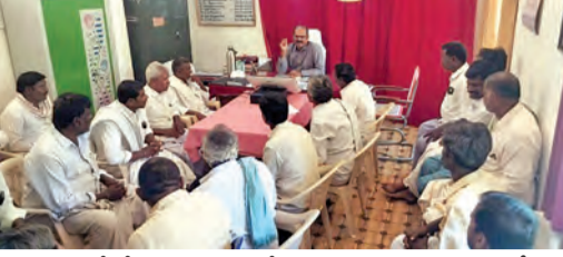
భూమిని కోల్పోతున్న రైతులతో రెవెన్యూ అధికారుల సమావేశం

అడివిపాటి, ఏప్రిల్ 19, ప్రభాతవార్త: తరతరాలుగా తమకు జీవనాధారంగా ఉన్న భూములను కమలపాడు పంపుడ్ స్టోరేజీ ప్రాజెక్టు (పిఎస్ హెచ్పి)కి భూసేకరణలో భాగంగా కోల్పోతున్న అన్నదాతల్లో ఆందోళన, సందిగ్ధత నెలకొంది. ఇప్పటికే గుడిపాడు, కమలపాడు, కుందగనకల్ రెవెన్యూ గ్రామాల పరిధిలో సాగర్ సిమెంట్స్ (పిఎంఎం), అదాని సిమెంట్స్ (పెన్సా) కర్మాగారాలకు పెద్ద ఎత్తున రైతులు భూములను కోల్పోయారు. ప్రస్తుతం ఈ పిఎస్ హెచ్పి కోసం దాదాపు 264 మంది రైతులు 398 ఎకరాలకు పైగా వ్యవసాయ భూములను కోల్పోతున్నందున వ్యవసాయమే ఆధారంగా జీవనం సాగిస్తున్న తమ భవిష్యత్తును, ప్రభుత్వం చెల్లించనున్న పరిహారంపై వారిలో సందిగ్ధత నెలకొంది. భూముల వారీగా భూసేకరణపై ప్రభుత్వం స్పష్టమైన ప్రకటన ఇచ్చినప్పటికీ తమ భూముల ధరలపై స్పష్టత కొరవడంతో అన్నదాతల్లో ఆందోళన నెలకొంది. ఇటీవల సమీప గ్రామంలో ఓ సిమెంట్ కర్మాగారం సేకరించిన ధరలే తమకు చెల్లిస్తారని... లేక ప్రభుత్వం