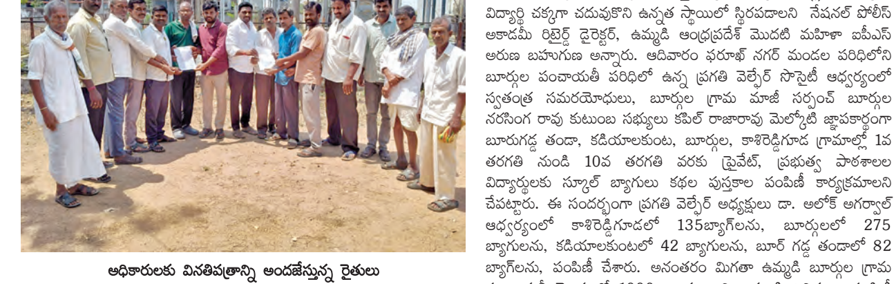
అధికారులకు వినతిపత్రాన్ని అందజేస్తున్న రైతులు