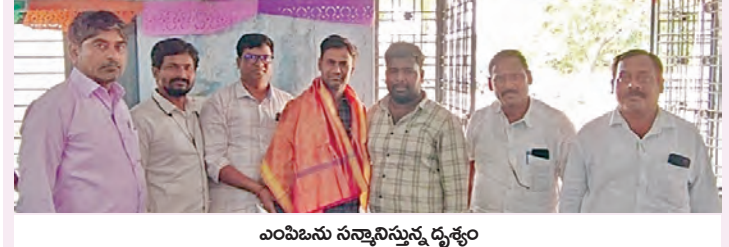
ఎంపిఐసీ సన్మానిస్తున్న దృశ్యం