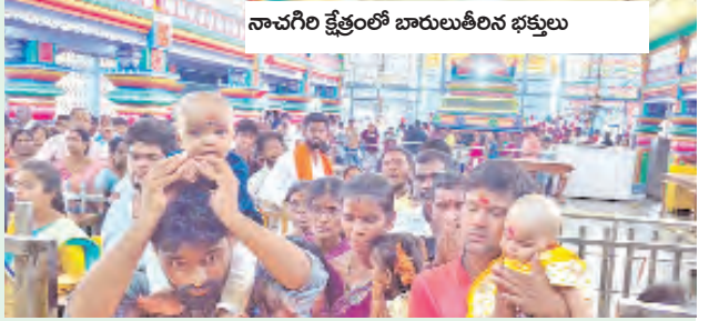
నాచగిరి క్రీడల్లో బాలులీలన భక్తులు

వచ్చే కెనీ ఆల్ ట్రోఫికి ఉమ్మడి క్రికెట్ ట్రోఫి ఏర్పాటు చేస్తామన్నారు. మహిళాలో సైతం క్రీడా సూక్ష్మిని చాటుతున్నారని, క్రికెట్లోనే ఆల్ రౌండ్ కాదు నిజ జీవితంలో సైతం