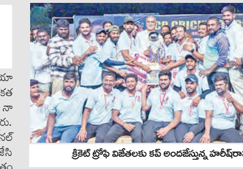
క్రికెట్ ట్రోఫి విజేతలకు కవ్ అందజేస్తున్న హరికృష్ణ

అప్పడే సిద్దిపేట స్టేడియానికి సాక్షాత్కరణ క్రికెట్లోనే ఆల్ రౌండ్ కాదు నిజ జీవితంలో సైతం యువత ఆల్ రౌండ్ గా ఎదగాలి - మాజీ మంత్రి, ఎమ్మెల్యే హరికృష్ణ