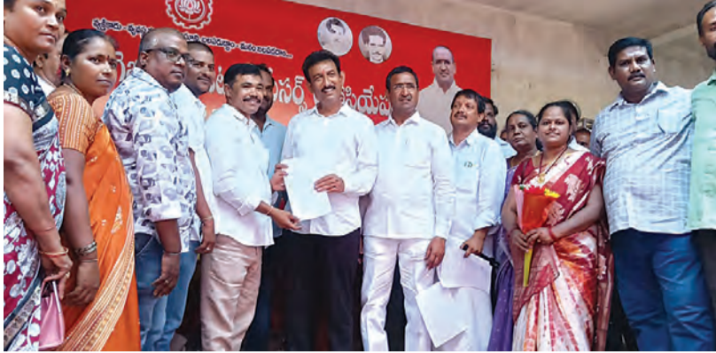
ఇంటర్మీడియట్ విద్యాశాఖలో నాన్ టీచింగ్ సిబ్బంది ప్రమోషన్లు ఆరు నెలలుగా నిలిచిపోవడంతో ఉద్యోగుల్లో ఆందోళన నెలకొంది. జోన్ 4 అర్థిడి కడప కార్యాలయం నుంచి ప్రమోషన్లు ప్రక్రియలో