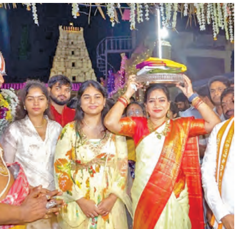
రాత్రి వరకు చివరి భక్తుడి కి దర్శనం అయినంతవరకు ఆమె దగ్గరుండి చూసుకున్నారు.