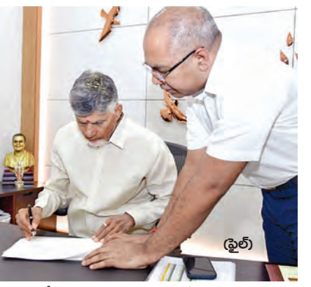
మార్గంలో గవనరం ఎయిర్ పోర్టుకు వెళుతున్న సమయంలో సింహఆర్ఎఫ్ ఫైల్పై ముఖ్యమంత్రి చంద్రబాబు సంతకం చేశారు. ఆనువత్తుల్లో చికిత్స

విజయవాడ, ఏప్రిల్ 20 ప్రభాతవార్త ప్రతినిధి: ముఖ్యమంత్రి చంద్రబాబు నాయుడు తన జన్మదినం సందర్భంగా సింహ సహాయ నిధి నుంచి రూ.56 కోట్ల విడుదలకు సంతకం చేసారు. శుభకార్యాలు, ప్రాధాన్యత ఉన్న రోజుల్లో పేదలకు మేలు చేసే కార్యక్రమంతో ఆ రోజును ప్రారంభించడం ఆనవాయితీ చేసుకున్నారని ముఖ్యమంత్రి చంద్రబాబు. ఊది రోజు, న్యూఇయర్ వంటి సందర్భాల్లో పేదలకు మేలు చేసే సింహఆర్ఎఫ్ ఫైలుపై తొలి సంతకం చేసి రోజు వారి విధులు ప్రారంభిస్తున్నారు. ఈ క్రమంలో తన పుట్టిన రోజు సందర్భంగా ముఖ్యమంత్రి చంద్రబాబు మరోసారి ఇదే ఆనవాయితీని కొనసాగించారు. ఉండవల్లి సింహ ఆర్ఎఫ్ కార్యాలయంలో టిటిడి, దుర్గంగడి పండితుల వేద ఆశీర్వాదం తరువాత ముఖ్యమంత్రి చంద్రబాబు అధ్యక్షాంజ్ఞీను వెళ్లారు. ఆశీర్వాదాలలో కలిసి ఆల్పాహారం తీసుకున్నారు. ఆనంతరం రోడ్డు