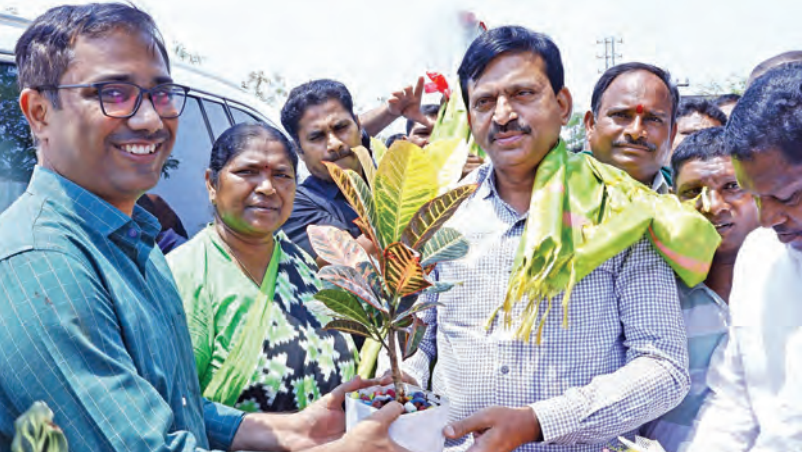
ములుగుజిల్లా పోలీస్ ఠాణా అధ్యక్షులలో నిర్వహించిన లైవ్ లైట్ల రోడ్డు భద్రతా అభిమాన కార్యక్రమంలో పాల్గొనేందుకు వచ్చిన మంత్రులు పొంగలెటి శ్రీనివాస్ రెడ్డి, సీతకలకు సాగుగం పలుకుతున్న జిల్లా కలెక్టర్

ప్రభాతవార్ ప్రతినిధి - జయశంకర్ భూపాలపల్లి బ్యారీ జయశంకర్ భూపాలపల్లి జిల్లా మహాచేపూర్ కాశేశ్వరం ప్రాజెక్టు పేరుతో గత ప్రభుత్వం ఛార్ డోపిడీకి పాల్పడిందని, ఈ కుంభకోణంలో డోపిడీలు ఎంతటి వాణిగా శక్తివంత తీరుతామని ముఖ్యమంత్రి ఎన్ఎంఎల రేవంత్ రెడ్డి స్పష్టం చేశారు. సోమవారం కాశేశ్వరం ప్రాజెక్టులో భాగమైన మేడిగడ్డ బ్యారీని సందర్శించి అధికారంలో సమీకృత జరిపిన తర్వాత మీడియా సమావేశంలో మాట్లాడారు. ప్రాజెక్టు రీడిజైనింగ్ నుంచి మేడిగడ్డ కుప్పకూలే వరకు జరిగిన పరిణామాలపై ఆగ్రహం వ్యక్తం చేశారు. 1975లో జలగం వెంగళరావు హయాంలోనే గోదావరి జలాల వినియోగంపై మహారాష్ట్రలో ఒప్పందం 13 జరిగిందని రేవంత్ గుర్తు చేశారు. 2009లో వైఎస్సార్ హయాంలో రూ.38,063 కోట్లతో మొదలైన ప్రాజెక్టులో ప్రాజెక్టును, కేసీఆర్ ప్రభుత్వం చేసేటం ఆర్థిక, రాజకీయ