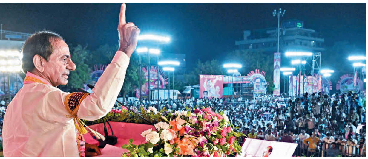
సోమవారం జగిత్యాలలో జరిగిన ప్రజా ఆశీర్వాద బహిరంగ సభలో మాట్లాడుతున్న మాజీ సీఎం కెసిఆర్