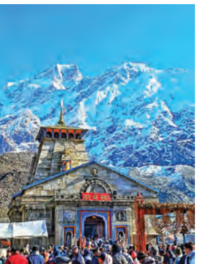
बाबा केदारनाथ धाम

'अनहद नाद' सुनाई देता है जो इन ऊँची चोटियों में गूँज रहा है। अपने भीतर शिवत्व को जागृत करने के लिए यात्रा के दौरान इन चार स्तंभों का आश्रय लें: पवित्र मंत्र जप: 'ॐ नमः शिवाय' केवल एक मंत्र नहीं, बल्कि शिव तत्व के पवित्र मंत्र हैं। निरंतर जप आपके सूक्ष्म शरीर को शुद्ध करता है और आपको पहाड़ों की ऊर्जा के अनुकूल बनाता है। मौन चिंतन: जितना हो सके, वाणी का समय रखें। व्यर्थ की बातों से ऊर्जा खर्च होती है। हिमालय की शांति को अपने भीतर उतारें। गहन ध्यान: यात्रा के पड़ावों पर कुछ समय आँखें बंद कर बैठें। अनुभव करें कि हिमालय की प्राणवायु आपके भीतर के विकारों को धो रही है। समर्पण: यह मान लें कि आप कुछ नहीं कर रहे, सब शिव की कृपा से हो रहा है।