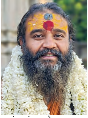
संत महंत महादेव दास बाबा नंदा देवी पर्यट, उत्तराखंड

हिमालयी उद्घोष: महादेव की दिव्य उपस्थिति और आत्म-साक्षात्कार का महापथ