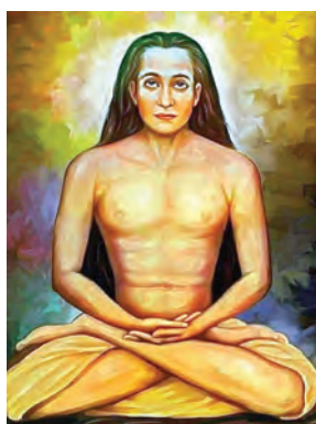
बाबा केदारनाथ धाम

उत्तराखंड की यह पावन धरा, जिसे हम श्रद्धा के साथ 'देवभूमि' पुकारते हैं, केवल पर्वतों और नदियों का समूह मात्र नहीं है। यह पृथ्वी का वह कोना है जहाँ जड़ और चेतन के बीच की दूरी समाप्त हो जाती है। हिमालय की कण-कण, प्रत्येक शिला और हर बहती जलधारा उस आदि-अनंत शिव तत्व की गूँज से ओतप्रोत है। यह भूमि एक जीवंत ऊर्जा क्षेत्र है, जिसने युगों-युगों से तपस्वियों, योगियों और सत्य के खोजी साधकों को अपनी ओर आकर्षित किया है। इस अलौकिक साम्राज्य के केंद्र में भगवान शिव का भव्य केदारनाथ धाम विराजमान है। केदारनाथ केवल पत्थरों से निर्मित एक मंदिर नहीं है, बल्कि यह वह द्वार है जहाँ पृथ्वी के मनुष्य की श्रद्धा चेतना ब्रह्मांडीय चेतना में विलीन होने लगती है।