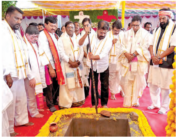
భూమి పూజ నిర్వహిస్తున్న ముఖ్యమంత్రి రేవంత్ రెడ్డి

రూ.198 కోట్లతో అలయ అభివృద్ధి పనులకు సీఎం రేవంత్ రెడ్డి శంకుస్థాపన