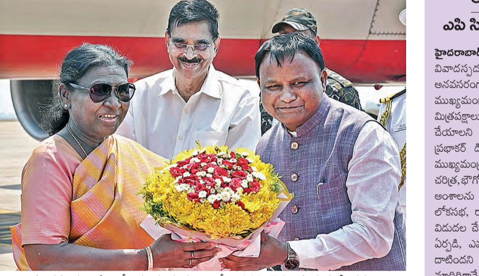
మంగళవారం ఒడిశాలోని రూర్క గూడ జిల్లాలో రాష్ట్రపతి ద్రౌపది ముర్ముకు స్వాగతం పలుకుతున్న ముఖ్యమంత్రి మోహన్ చరణ్. చిత్రంలో గవర్నర్ కంభంపాటి హరిబాబు