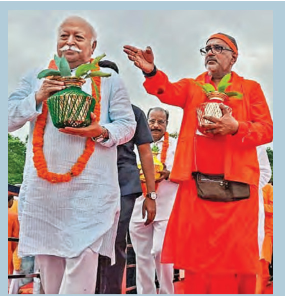
పశ్చిమ త్రిపురలోని మోహన్ పూర్లో సౌందర్య చిన్నయి ఆలయంలో ప్రత్యేక పూజలు చేస్తున్న ఆర్ఎస్ఎస్ చీఫ్ మోహన్ భగవత్