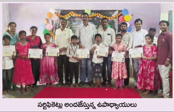
సర్టిఫికేట్లు అందజేస్తున్న ఉపాధ్యాయులు