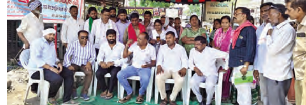
ఆర్టీసీ కార్మికుల సమస్యలు పరిష్కరించాలి