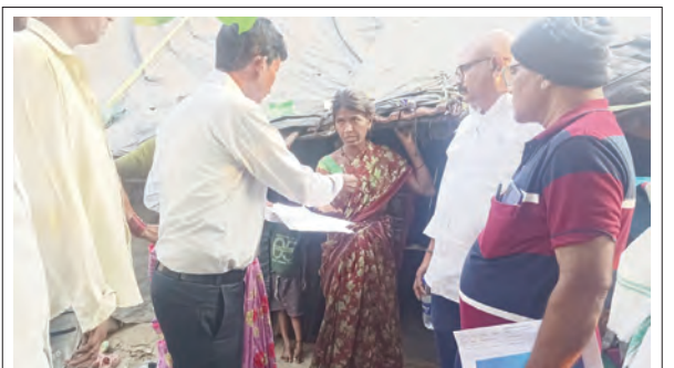
ఇందిరమ్మ ఇంటి లబ్ధిదారులతో మాట్లాడుతున్న పిడి