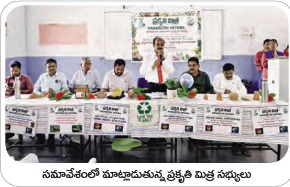
సమావేశంలో మాట్లాడుతున్న ప్రకృతి మిత్ర సభ్యులు