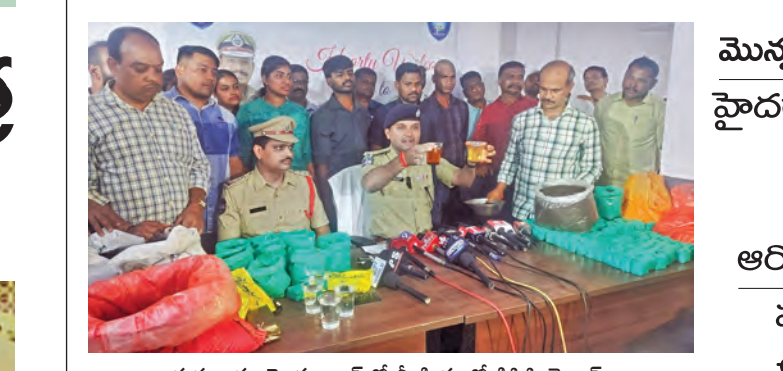
గురువారం హైదరాబాద్ లో మీడియాతో డిసీపి గైక్యాడ్

మొన్న నూనె, నిన్న మటన్, నేడు కల్లీ టీ పాడి హైదరాబాద్ లో పట్టుబడిన 4 టన్నుల కల్లీ పొడర్, రసాయనాలు అధిక లాభాల కోసం ప్రజల ఆరోగ్యంతో వ్యాపారుల చెలగాటం పలు దుకాణాల్లో కల్లీ బ్రాండ్ ఉన్నాయంటున్న అధికారులు హైదరాబాద్ (గోపాల్), ఏప్రిల్ 23 ప్రభాతవార్: హైదరాబాద్ లో ఇటీవల వెలుగు చూస్తున్న వరుస కల్లీ ఉదంతాలు నగరవాసులను ఉలిక్కిపడేలా చేస్తున్నాయి. నిన్న మటన్, మొన్న నూనె... ఇలా రోజుకో కొత్త రూపంలో ప్రాణాంతక కల్లీ దండాలు బయటపడుతున్నాయి. తాజాగా భాగ్యనగరంలో మరో భారీ కల్లీ టీ పొడర్ మూడు గుట్టును పోలీసులు రట్టు చేశారు. పోలీసులు, రహస్య సమాచారం మేరకు జరిపిన మొదటి దాడుల్లో సుమారు 4 టన్నుల కల్లీ టీ పొడర్, దానికి సంబంధించిన రసాయనాలను అధికారులు స్వాధీనం చేసుకున్నారు. హైదరాబాద్ ఏకైక అడ్డం రేపన్ సర్కిలైస్ లోని నగరవ్యాప్తంగా 15 ప్రాంతాల్లో ఏకకాలంలో ఆరోగ్యకరమైన నిర్వహించింది. కల్లీ టీ పొడిని తయారుచేస్తూ, విక్రయిస్తున్న తయారీ కేంద్రాలే లక్ష్యంగా సాగిన ఈ ఆపరేషన్ లో విస్తూపోయే నిజాలు వెలుగులోకి వచ్చాయి. అధిక లాభాల కోసం నిందితులు తక్కువ నాణ్యత గల టీ పొడికి కల్లీ మ రంగులు, గండుపుసుగిసిన ముడి పదార్థాలను కలిపి వినియోగదారుల ఆరోగ్యంతో చెలగాటమడుతున్నట్లు అధికారులు గుర్తించారు. ఈ కల్లీ పొడిని రోడ్డు పక్కన ఉండే టీ స్టాళ్లలో పాలు కొన్ని ప్రముఖ విక్రయకలకులకు కూడా సరఫరా చేస్తున్నట్లు విచారణలో తెలిసింది. ఈ అక్రమ కార్యకలాపాలకు పాల్పడుతున్న పది మంది నిందితులను పోలీసులు అరెస్ట్ చేశారు. >>2