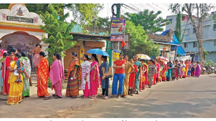
బెంగళూరులోని మిద్దుపూర్లో గురువారం ఓటు వేసేందుకు క్యూలో ఉన్న ఓటర్లు