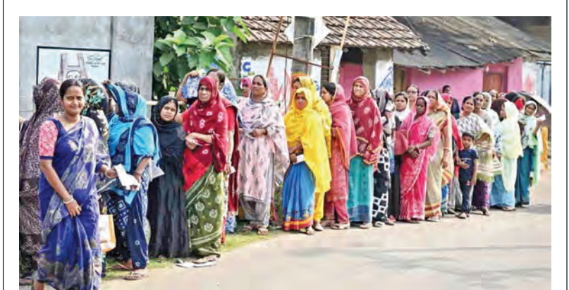
బెంగాల్ లోని నందిగ్రామ్ లో ఓటు వేసేందుకు క్యూలో ఉన్న ఓటర్లు

ఓటెత్తిన బెంగాల్ రాష్ట్ర చరిత్రలోనే అత్యధికంగా 92 శాతం పోలింగ్ తమిళనాట కూడా రికార్డు స్థాయిలో 84 శాతం బెంగాల్ పోలింగ్ హింసాత్మకం, బిజెపి అభ్యర్థులపై దాడి, వాహనాలు ధ్వంసం పలుచోట్ల రాక్షసుల వ్యవహారాలు, లాఠీఛార్జి కోల్కత్తా / చెన్నై, ఏప్రిల్ 23: దేశంలోని నందిగ్రామ్ లో జరిగిన ఎన్నికల్లో చరిత్రలోనే ఎన్నడూ లేనంతగా ఓటర్లు పోలింగ్ కేంద్రాలకు వచ్చి తమ ఓటు హక్కు వినియోగించుకున్నారు. తమిళనాడులోని 234 స్థానాలకు ఒకే విడతగా జరిగిన ఎన్నికల్లో 84.51 శాతం ఓటు హక్కు వినియోగించుకున్నట్లు ఎన్నికల సంఘం ప్రకటించింది. సాయంత్రం ఆరు గంటలు దాటినప్పటికీ పోలింగ్ కేంద్రాల్లో బాంబులు తీరి ఓటర్లు వేచి ఉండటం ఓటు హక్కు వినియోగంపై వెరిగిన అవగాహనకు నిదర్శనంగా తెలుస్తోంది. రెండూ రాష్ట్రాల్లోని రికార్డు స్థాయి >>2