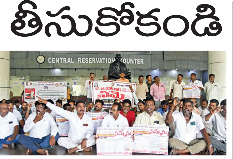
గురువారం ఎంజిబిఎస్ లో ఆందోళన చేస్తున్న ఆర్టీసీ జెఎస్ నాయకులు

ప్రాణాలు తీసుకోకండి తొందరపాటు నిర్ణయాలు వద్దు: ఆర్టీసీ కార్మికులకు సీఎం రేవంత్ హితవు నేడు కార్మిక సంఘాలతో డిసీఎం భట్టి ఆధ్వర్యంలో చర్చలు కార్మిక సోదరులు ఆత్మబలిదానాలు చేసుకోవద్దని మంత్రుల వినతి ప్రభాతవార్ ప్రధాన ప్రతినిధి, హైదరాబాద్, ఏప్రిల్ 23: ఆర్టీసీ సమస్యపై శుక్రవారం కార్మికులతో మాట్లాడాలని ప్రభుత్వం నిర్ణయించింది. ఈ మేరకు ముఖ్యమంత్రి రేవంత్ రెడ్డి మంత్రులను ఆదేశించారు. శుక్రవారం డిప్యూటీ సీఎం భట్టి విక్రమార్క ఆధ్వర్యంలోని మంత్రుల బృందం కార్మిక సంఘాలతో చర్చలు జరపనుంది. గురువారం సాయంత్రం సచివాలయంలో జరిగిన కేబినెట్ సమావేశంలో సమస్యపై ప్రధానంగా చర్చ జరిగింది. నర్సంపేట, నల్గొండ ఘటనల నేపథ్యంలో ఆర్టీసీ కార్మికులు ఎలాంటి తొందర పాటు నిర్ణయాల తీసుకోవద్దని ముఖ్యమంత్రి రేవంత్ రెడ్డి విజ్ఞప్తి చేశారు. ప్రాణాలు తీసుకోవడం వల్ల సమస్య పరిష్కారం కాదని కార్మికుల సమస్యలను >>2