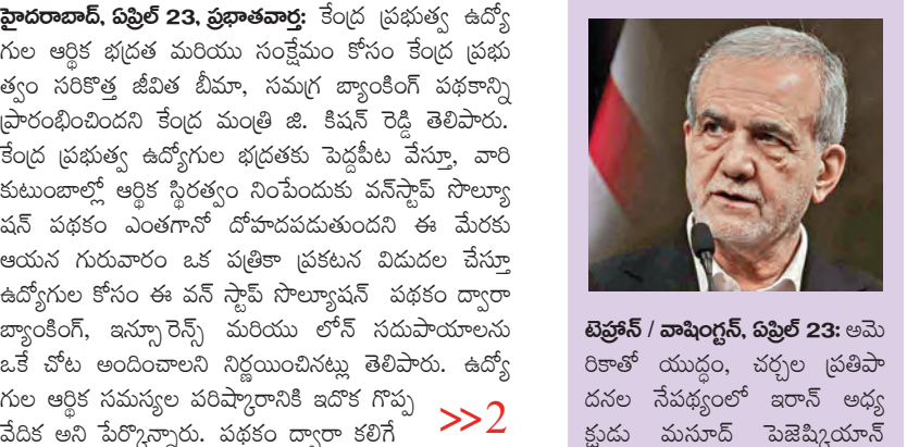
అమెరికా మాటలు మేం నమ్మం -పెజెషియాన్

ఇక కొత్త బీమా, బ్యాంకింగ్ పథకాలు ఉద్యోగుల ఆర్థిక భద్రతకు ప్రాధాన్యం: కేంద్రమంత్రి కిషన్ రెడ్డి హైదరాబాద్, ఏప్రిల్ 23, ప్రభాతవార్: కేంద్ర ప్రభుత్వ ఉద్యోగుల ఆర్థిక భద్రత మరియు సంక్షేమం కోసం కేంద్ర ప్రభుత్వం సరికొత్త బీమా, సమృద్ధి బ్యాంకింగ్ పథకాన్ని ప్రారంభించినందుకు కేంద్ర మంత్రి కిషన్ రెడ్డి తెలిపారు. కేంద్ర ప్రభుత్వ ఉద్యోగుల భద్రతకు పెద్దపీట వేస్తూ, వారి కుటుంబాల్లో ఆర్థిక స్థిరత్వం నింపేందుకు వన్ స్టాప్ సొల్యూషన్ పథకం ఎంతగానో దోహదపడుతుందని ఈ మేరకు ఆయన గురువారం ఒక పత్రికా ప్రకటన విడుదల చేస్తూ ఉద్యోగుల కోసం ఈ వన్ స్టాప్ సొల్యూషన్ పథకం ద్వారా బ్యాంకింగ్, ఇన్సూరెన్స్ మరియు లోన్ సదుపాయాలను ఒకే చోట అందించాలని నిర్ణయించినట్లు తెలిపారు. ఉద్యోగుల ఆర్థిక సమస్యల పరిష్కారానికి ఇదొక గొప్ప వేదిక అని పేర్కొన్నారు. పథకం ద్వారా కలిగే >>2