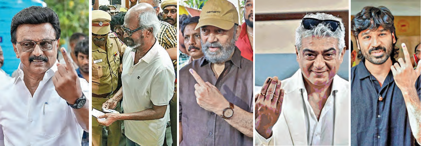
గురువారం తమిళనాడు ఎన్నికల్లో ఓటు వేసిన సీఎం స్టాలిన్, రజనీకాంత్, కమల్ హాసన్, అజిత, ధనుష్