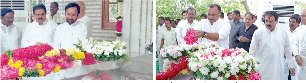
గురువారం నాదెండ్ల భాస్కరరావు ఛాతీకార్యం వద్ద నివాళులర్పిస్తున్న కేంద్రమంత్రి కిషన్ రెడ్డి, మంత్రి కోమటిరెడ్డి వెంకటరెడ్డి

హైదరాబాద్ (జూబ్లీహిల్స్), ఏప్రిల్ 23, ప్రభాతవార్త: అక్కడికి చేరుకొని నాదెండ్ల మనోహర్ తోపాటు ఉమ్మడి ఆంధ్రప్రదేశ్ ముఖ్యమంత్రి నాదెండ్ల వారి కుటుంబసభ్యులను ఓదార్చారు. పోలీసుల