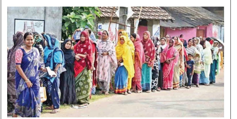
బెంగాల్ లోని నందిగ్రామ్ లో ఓటు వేసేందుకు క్యూలో ఉన్న ఓటర్లు

ఓటెత్తిన బెంగాల్ రాష్ట్ర చరిత్రలోనే అత్యధికంగా 92 శాతం పోలింగ్ తమిళనాడు కూడా రికార్డు స్థాయిలో 84 శాతం బెంగాల్ పోలింగ్ హింసాత్మకం, బిజెపి అభ్యర్థులపై దాడి, వామానాలు ధ్వంసం పలుచోట్ల రాళ్లురువ్వివిన ఘటనలు, లాఠీఛార్జి కోట్లా / చెన్నై ఏప్రిల్ 23: దేశంలోరెండురాష్ట్రాల్లో జరిగిన ఎన్నికల్లో చరిత్రలోనే ఎన్నడూ లేనంతగా ఓటర్లు పోలింగ్ కేంద్రాలకు వచ్చి తమ ఓటు హక్కు వినియోగించుకున్నారు. తమిళనాడులోని 234 స్థానాలకు ఒకే విడతగా జరిగిన ఎన్నికల్లో 84.51 శాతం ఓటు హక్కు వినియోగించుకున్నట్లు ఎన్నికల సంఘం ప్రకటించింది. సాయంత్రం ఆరు గంటలు దాటినప్పటికీ పోలింగ్ కేంద్రాల్లో బారులు తీరి ఓటర్లు వేచి ఉండటం ఓటుహక్కు వినియోగంపై పెరిగిన అవగాహనకు నిదర్శనంగా తెలుస్తోంది. రెండురాష్ట్రాల్లోని రికార్డుస్థాయి