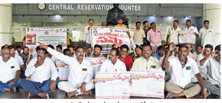
గురువారం ఎంజిబిఎస్ లో ఆందోళన చేస్తున్న ఆర్టీసీ జెఎస్ నాయకులు

తొందరపాటు నిర్ణయాలు వద్దు: ఆర్టీసీ కార్మికులకు సిఎం రేవంత్ హితవు నేడు కార్మిక సంఘాలతో డిసెంబర్ భట్టి ఆధ్వర్యంలో చర్చలు కార్మిక సోదరులు ఆత్మబలిదానాలు చేసుకోవద్దని మంతుల వినతి ప్రభాతవార్ ప్రధాన ప్రతినిధి, హైదరాబాద్, ఏప్రిల్ 23: ఆర్టీసీ సమ్మెపై శుక్రవారం కార్మికులతో మాట్లాడాలని ప్రభుత్వం నిర్ణయించింది. ఈ మేరకు ముఖ్యమంత్రి రేవంత్ రెడ్డి మంతులను ఆదేశించారు. శుక్రవారం డివ్యూటీ సీఎం భట్టి విక్రమార్కు ఆధ్వర్యంలోని మంతుల బృందం కార్మిక సంఘాలతో చర్చలు జరపనుంది. గురువారం సాయంత్రం సచివాలయంలో జరిగిన కేబినెట్ సమావేశంలో సమ్మెపై ప్రధానంగా చర్చ జరిగింది. నర్సంపేట, నల్గొండ ఘటనల నేపథ్యంలో ఆర్టీసీ కార్మికులు ఎలాంటి తొందర పాటు నిర్ణయాలు తీసుకోవద్దని ముఖ్యమంత్రి రేవంత్ రెడ్డి విజ్ఞప్తి చేశారు. ప్రాణాలు తీసుకోవడం వల్ల సమస్య పరిష్కారం కాదని కార్మికుల సమస్యలను