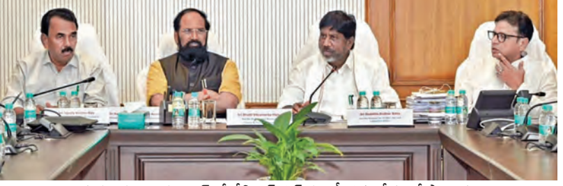
శుక్రవారం హైదరాబాద్ లో కేబినెట్ సభ కమిటీ సమావేశంలో పాల్గొన్న డి.సి.ఎం భట్టి, మంత్రులు ఉత్తమ్, శ్రీధర్ బాబు, జూపల్లి

నగరాన్ని, రాష్ట్రాన్ని అభివృద్ధి చేయడమే ప్రభుత్వ లక్ష్యం మే మొదటివారం నుంచి సవరించిన భూముల విలువ అమలు కేబినెట్ సభకమిటీ భేటీలో డి.సి.ఎం భట్టి విక్రమార్క