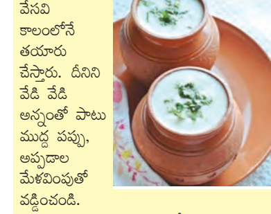
ఇంతకన్నా రుచికరమైన, ఆరోగ్యకరమైన అవకాశం మరో విధంగా కానీ, మరో రూపంలో కానీ లేదంటే..

ఇది వేసవిలో బాగా తరవాని పులుస్తుంది. ఎక్కువగా దీనిని వేసవి కాలంలోనే తయారు చేస్తారు. దీనిని వేడి వేడి అన్నంతో పాటు ముద్ద పప్పు, అప్పుడాల మేజింపుతో వడ్డించండి.