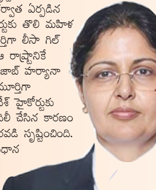
గత నెలలో ఆంధ్రప్రదేశ్ హైకోర్టు పూర్వపు జస్టిస్ గిల్ నియమితులైన జస్టిస్ గిల్, ఏప్రిల్ 25న ఆ కోర్టు ప్రధాన

కొత్త విధానం, కొత్తా సర్వోన్నత పదవి, కొత్త హైకోర్టు, కొత్త ప్రాంతం, నవ్యాంధ్రప్రదేశ్ హైకోర్టుకు తొలి మహిళా ప్రధాన న్యాయమూర్తిగా నియమితులై జస్టిస్ లీసా గిల్ చరిత్ర సృష్టించారు. రాష్ట్ర విభజన కర్తవ్యం పర్చిన ఆంధ్రప్రదేశ్ హైకోర్టుకు తొలి మహిళా ప్రధాన న్యాయమూర్తిగా లీసా గిల్ నియమితులవడం ఆ రాష్ట్రానికే వన్నె తెచ్చింది. పంజాబ్ హైకోర్టు హైకోర్టులో న్యాయమూర్తిగా పనిచేసి.. ఆంధ్రప్రదేశ్ హైకోర్టుకు న్యాయమూర్తిగా బదిలీ చేసిన కారణం కొలిజియం కొత్త పదవీ స్థానంబింది. ఆమెను హైకోర్టు ప్రధాన న్యాయమూర్తిగా పట్టా కట్టాలని తలచానో ఇక్కడికి వచ్చింది.