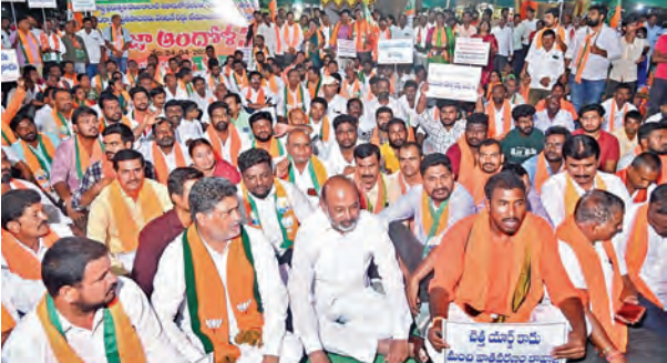
శుక్రవారం హుజూరాబాద్ లో జరిగిన ప్రజా ఆందోళనలో పాల్గొన్న కేంద్ర మంత్రి బండి సంజయ్

హుజూరాబాద్ మున్సిపాలిటీ అన్న విషయం ముఖ్యమంత్రి రేవంత్ రెడ్డి తెలుసా? ఆయనకు నివేదికలు ఇచ్చిన నాయకులు ఎవరు? అధికారులు ఎవరు? ప్రజల ప్రాణాలు ముఖ్యమా? నాలుగ జిల్లాల చెత్త చెదారం, జంతువులు కలెక్షన్లను తీసుకువచ్చి ఈ ప్రాంత ప్రజలను సమాధి చేస్తారా? కబర్లలో కాంగ్రెస్ నేతలలా తక్షణమే వాస్తవిక స్థితిగతులను ఈ ప్రాంత ప్రజల మహాభావాలను స్థానిక కాంగ్రెస్ నేతలు రాష్ట్ర ప్రభుత్వానికి వివరించండి. వేస్ట్ టు ఎనర్జీ ప్లాంట్ ను జన సాంద్రత లేని సుదూర ప్రాంతానికి తరలించండి అంటూ బండి సంజయ్ కుమార్ కాంగ్రెస్ ప్రభుత్వాన్ని హెచ్చరించారు. కాంగ్రెస్ నేతలు నిర్లక్ష్యం చేస్తే.. మీ ఇంట్ల ముందు ప్రాంతానికి తరలించిన జంతువుల కలెక్షన్లతో వేస్తాం.. >>2