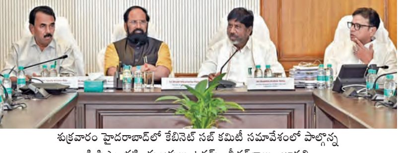
శుక్రవారం హైదరాబాద్ లో కేబినెట్ సభ కమిటీ సమావేశంలో పాల్గొన్న డి.సి.ఎం భట్టి, మంత్రులు ఉత్తమ్, శ్రీధర్ బాబు, జూపల్లి

నగరాన్ని, రాష్ట్రాన్ని అభివృద్ధి చేయడమే ప్రభుత్వ లక్ష్యం మే మొదటివారం నుంచి సవరించిన భూముల విలువ అమలు కేబినెట్ సభకమిటీ భేటీలో డి.సి.ఎం భట్టి విక్రమార్క >>2