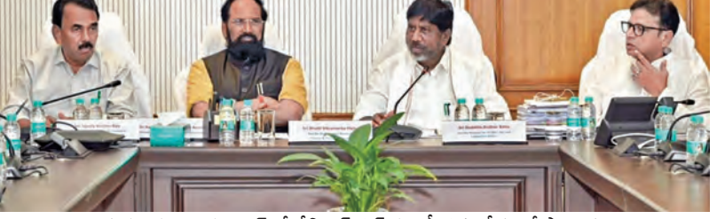
శుక్రవారం హైదరాబాద్ లో కేబినెట్ సభ కమిటీ సమావేశంలో పాల్గొన్న డి.సి.ఎం భట్టి, మంత్రులు ఉత్తమ్, శ్రీధర్ బాబు, జూపల్లి

నగరాన్ని, రాష్ట్రాన్ని అభివృద్ధి చేయడమే ప్రభుత్వ లక్ష్యం మే మొదటివారం నుంచి సవరించిన భూముల విలువ అమలు కేబినెట్ సభకమిటీ భేటీలో డి.సి.ఎం భట్టి విక్రమార్క