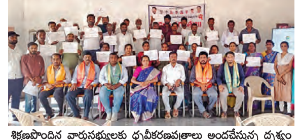
శిక్షణ పొందిన వార్డుసభ్యులకు దృవీకరణపత్రాలు అందజేస్తున్న దృశ్యం