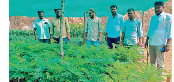
నర్సాపూర్ పరిశీలిస్తున్న ఎంపీడిఎస్ కార్యకర్తలు