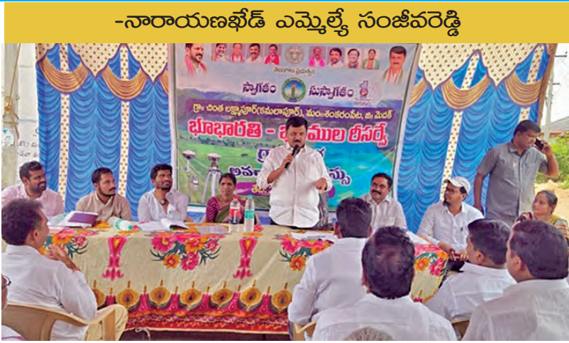
సమావేశం మాట్లాడుతున్న ఎమ్మెల్యే సంచారం

పెద్దశంకరంపేట, ఏప్రిల్ 24, ప్రభాతవార్త: కాంగ్రెస్ ప్రభుత్వం రైతుల భూసమస్యల శాశ్వత పరిష్కారం కోసం భూభారతి కార్యక్రమం ద్వారా భూముల రీసర్వే చేపట్టినట్లు నారాయణపేట ఎమ్మెల్యే సంచారం తెలిపారు. శుక్రవారం మండల పరిషత్లోని కమలాపూర్లో నిర్వహించిన గ్రామ సభలో ఎమ్మెల్యే సంచారం పాల్గొని మాట్లాడారు. ఈ సందర్భంగా ఎమ్మెల్యే సంచారం మాట్లాడుతూ భూముల రికార్డుల్లో ఉన్న పొరపాట్లు, సరిహద్దు వివాదాలు, హక్కుల సమస్యలను పూర్తిగా నివారించడమే భూముల రీసర్వే లక్ష్యమని తెలిపారు. ప్రభుత్వం అత్యధునిక సాంకేతికతతో ఈ రీసర్వేను చేపట్టనున్నట్లు పేర్కొన్నారు. వివాదాలను అధిగమించడానికి గ్రామంలోని ప్రతి ఇంటి భూమిని కూడా డిజిటల్ పద్ధతిలో సర్వే చేయనున్నట్లు వివరించారు. ఈ సర్వే పూర్తయిన తర్వాత ప్రతి భూకమిని ఖచ్చితంగా సరిహద్దు కేటాయింపునున్నట్లు తెలిపారు. అనంతరం ఎడి కిపిన్ మాట్లాడుతూ జిల్లాలో మొత్తం రూ. 24 గ్రామాలను మొదటగా రీసర్వేను ఎంపిక చేసినట్లు తెలిపారు. ముందుగా గ్రామ సమస్యలను నిర్ణయించి అనంతరం ప్రభుత్వ భూముల సర్వే,