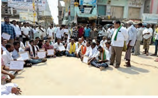
మండల కేంద్రంలోని నాలుగు రోడ్ల కూడలిలో ఆక్రమణకు తప్పక తప్పక ప్రాంతానికి చెందిన ప్రజలకు ప్రజలకు, గ్రామాలకు నాయకులు పెద్ద ఎత్తున చేతుకుని ఇసుక రీచ్ రద్దు చేయాలని డిమాండ్ చేస్తూ ధర్మా నిర్వహించారు. మండలంలోని పలు గ్రామాల నుండి భారీగా తరలి వచ్చిన రైతులు, కార్మికులు ఆక్రమణకు తప్పక తప్పక జరుగుతున్న నియంత్రణ లేని ఇసుక తవ్వకాల వల్ల వ్యర్థాలను సేకరించిన వారు ఆవేదన వ్యక్తం చేశారు. భూగర్భ జలాలు క్షీణిస్తున్నాయని, బోర్డు ఎండిపోతున్నాయని, రైతులు తీవ్ర ఇబ్బందులు పడుతున్నారని తెలిపారు.