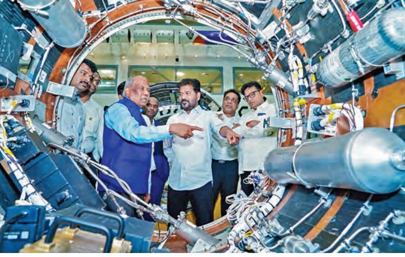
శనివారం హైదరాబాద్లో ఆర్బిఎల్ రాకెట్ విక్రమ్-1ను పరిశీలిస్తున్న సిఎం రేవంత్

సాంకేతికంగా తెలంగాణ మున్ముందుకు రాకెట్ విక్రమ్-1ను శ్రీహరికోటకు జెండా ఊపి పంపిన సిఎం రేవంత్ రెడ్డి రాకెట్ను రూపొందించిన స్పైరూట్ ఏరోస్పేస్ బృందాన్ని ప్రశంసించిన సిఎం రెడ్డి ఇంజనీరింగ్ వస్తువుల ఎగుమతుల్లో 117.9 శాతం వృద్ధి సాధించి పరిభ్రాంతి అద్వాన్స్ టెక్నాలజీ సెంటర్ను: సిఎం రేవంత్