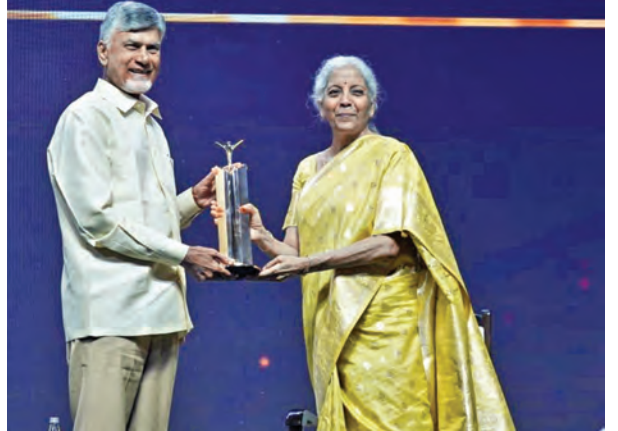
శనివారం ముంబైలో ఎకనమిక్ టైమ్స్ అవార్డును ఎపి సిఎం చంద్రబాబుకు ప్రధానం చేస్తున్న కేంద్ర ఆర్థికమంత్రి నిర్మలా సీతారామన్