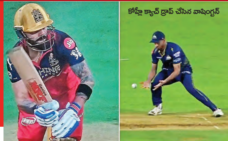
కోహ్లా క్యాచ్ ద్రావ్ చేసిన వాషింగ్టన్

శశాంక ఇచ్చిన లైఫ్ లైన్తో కేవల రాహుల్ ఏకంగా 152 రన్స్ చేశాడు. గుజరాత్ బౌలర్లను చెడామడా బాదుతూ 67 బంతుల్లోనే ఈ స్కోరు చేశాడు. నిశీష్ రాజాతో కలిసి 220 రన్స్ భాగస్వామ్యంతో డిల్లీ క్యాపిటల్స్కు ఏకంగా 264 రన్స్ సాధించిపెట్టాడు. గత లక్నో సూపర్ జెయింట్స్ మ్యాచ్లో కూడా శశాంక ఏకంగా మూడు క్యాచ్లు వదిలిపెట్టాడు.