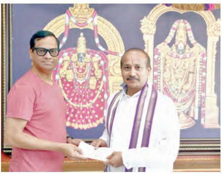
తిరుమలలోని ఆస్పత్రి ఉద్యోగులకు అతి తక్కువ ప్రీమియంతో ఎస్బిఐ బీమా పథకం గురించి అవగాహన కల్పించారు. శనివారం తిరుమల ఆస్పత్రి డిపార్ట్ మెంట్ ఎస్బిఐ హెల్త్ ఇన్సూరెన్స్ ఉద్యోగులు క్యాంపు నిర్వహించారు. కార్పొరేట్ శాలర్స్ ప్యాకేజీ కింద ఉన్న ఉద్యోగులందరికీ ప్రత్యేక ఆఫర్ కింద ఆరోగ్యబీమా అతి తక్కువ ప్రీమియం కు 55 లక్షల రూపాయలు వరకు హెల్త్ ఇన్సూరెన్స్ ఇవ్వడం జరిగింది. ఈ కార్యక్రమంలో ఎస్బిఐ రీజనల్ మేనేజర్, ఎస్బిఐ తిరుమల బ్రాంచ్ మేనేజర్, తిరుమల డిపార్ట్ మేనేజర్, ఆసిస్టెంట్ మేనేజర్లు, 70 మంది ఉద్యోగులు పాల్గొన్నారు.