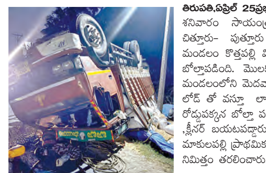
తిరుపతి, ఏప్రిల్ 25 ప్రభాతవార్త ప్రతినిధి: చిత్తూరు జిల్లాలో శనివారం సాయంత్రం ఓ ప్రమాదం జరిగింది.

చిత్తూరు - పుత్తూరు రహదారిలోని ఎస్ఆర్ పురం మండలంలోని మెదవూడ కోళ్ల ఫారం కు మొక్కజొన్నల లోడ్ తో వచ్చే లారీ ట్రైలు సేలడంలో అనుభవం లోడ్ తో వచ్చే లారీ ట్రైలు సేలడంలో అనుభవం