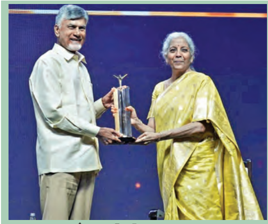
శనివారం ముంబైలో ఎకనమిక్ టైమ్స్ అవార్డును సీఎం చంద్రబాబుకు ప్రధానం చేస్తున్న కేంద్ర ఆర్థికమంత్రి నిర్మలా సీతారామన్

సంస్కరణలతో ఆర్థిక వ్యవస్థ మలిత మెరుగు ప్రధాని మోడీ లిఫార్మర్, పెర్ఫార్మర్, విన్నర్ నాలీ శక్తి బిల్లుతో మహిళలకు మేలు: సీఎం ముఖ్యమంత్రికి ఎకనమిక్ టైమ్స్ 'బిజినెస్ లిఫార్మర్ ఆఫ్ ది ఇయర్ 2025' పురస్కారం ప్రధానం అవార్డును అందజేసిన కేంద్ర ఆర్థికమంత్రి నిర్మలా సీతారామన్