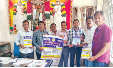
తిరుమలలోని ఆస్పత్రి ఉద్యోగులకు అతి తక్కువ ప్రీమియంతో ఎస్బిఐ బీమా పథకం గురించి అవగాహన కల్పించారు. శనివారం తిరుమల ఆస్పత్రి డిపార్ట్ మెంట్ ఎస్బిఐ హెల్త్ ఇన్సూరెన్స్ ఉద్యోగులు క్యాంపు నిర్వహించారు. కార్పొరేట్ శాలర్స్ ప్యాకేజీ కింద ఉన్న ఉద్యోగులందరికీ ప్రత్యేక ఆఫర్ కింద ఆరోగ్యబీమా అతి తక్కువ ప్రీమియం కు 55 లక్షల రూపాయలు వరకు హెల్త్ ఇన్సూరెన్స్ ఇవ్వడం జరిగింది. ఈ కార్యక్రమంలో ఎస్బిఐ రీజనల్ మేనేజర్, ఎస్బిఐ తిరుమల బ్రాంచ్ మేనేజర్, తిరుమల డిపార్ట్ మేనేజర్, ఆసిస్టెంట్ మేనేజర్లు, 70 మంది ఉద్యోగులు పాల్గొన్నారు.

తిరుమల, ఏప్రిల్ 25 ప్రభాతవార్త ప్రతినిధి: తిరుమలలోని ఆస్పత్రి ఉద్యోగులకు అతి తక్కువ ప్రీమియంతో ఎస్బిఐ బీమా పథకం గురించి అవగాహన కల్పించారు. శనివారం తిరుమల ఆస్పత్రి డిపార్ట్ మెంట్ ఎస్బిఐ హెల్త్ ఇన్సూరెన్స్ ఉద్యోగులు క్యాంపు నిర్వహించారు. కార్పొరేట్ శాలర్స్ ప్యాకేజీ కింద ఉన్న ఉద్యోగులందరికీ ప్రత్యేక ఆఫర్ కింద ఆరోగ్యబీమా అతి తక్కువ ప్రీమియం కు 55 లక్షల రూపాయలు వరకు హెల్త్ ఇన్సూరెన్స్ ఇవ్వడం జరిగింది. ఈ కార్యక్రమంలో ఎస్బిఐ రీజనల్ మేనేజర్, ఎస్బిఐ తిరుమల బ్రాంచ్ మేనేజర్, తిరుమల డిపార్ట్ మేనేజర్, ఆసిస్టెంట్ మేనేజర్లు, 70 మంది ఉద్యోగులు పాల్గొన్నారు.