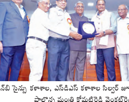
ఎన్ఐఐ సైన్సు కళాశాల, ఎన్ఐఐఐ కళాశాల సిల్వర్ జ్యూబిలీ కార్యక్రమంలో మంత్రి

మంత్రి కోమటిరెడ్డి వెంకటరెడ్డి హైదరాబాద్ (నార్సూర్), ఏప్రిల్ 25, ప్రభాతవార్త : విద్యార్థులు కష్టపడి బాగా చదువుకుని కళాశాలకు, డిగ్రీ కళాశాలకు చేరుకుంటే మంచి పేరు తీసుకు రావాలని రాష్ట్ర రోడ్డు భవనాలు, సినిమాటోగ్రఫీ శాఖల మంత్రి కోమటి రెడ్డి వెంకటరెడ్డి అన్నారు. పాఠశాల వారినే వారినే అగర్వాల్ శిక్షా సమితి ఆధ్వర్యంలో నడుస్తున్న ఎన్ఐఐ సైన్సు కళాశాల, ఎన్ఐఐఐ కళాశాల సిల్వర్ జ్యూబిలీ కార్యక్రమం శనివారం సెడెంట్ హాల్లో జరిగింది. ఈ కార్యక్రమానికి ముఖ్య అతిథిగా విచ్చేసిన రాష్ట్ర రోడ్డు భవనాలు, సినిమాటోగ్రఫీ శాఖల మంత్రి కోమటిరెడ్డి వెంకటరెడ్డి మాట్లాడుతూ తాను ఇంటర్మీడియట్ చదువుకున్న ఎన్ఐఐ సైన్సు కళాశాలకు మంత్రి హోదాలో రావడం ఎంతో సంతోషంగా ఉందని, ఉన్నత స్థాయిలో అభివృద్ధి కలిగి ఉండే విధంగా ఎన్ఐఐ సైన్సు కళాశాల నాకు తోడ్పడిందని