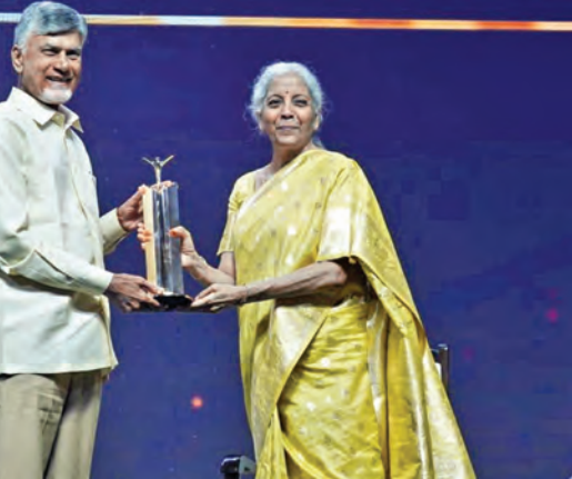
శనివారం ముంబైలో ఎకనమిక్ టైమ్స్ అవార్డును ఎపి సిఎం చంద్రబాబుకు ప్రధానం చేస్తున్న కేంద్ర ఆర్థికమంత్రి నిర్మలా సీతారామన్

ట్యూటర్, ఏవ అగ్రాసమి లాంటి సేవలు అందిస్తున్నామని తెలిపారు. మహిళా రిజర్వేషన్ బిల్లు విషయంలో కేంద్రప్రభుత్వ నిర్ణయం సరైనదేనని వ్యాఖ్యానించారు. లింగ సమానత్వం, మహిళలకు సమాన అవకాశం కల్పించేందుకు తీసుకువచ్చిన బిల్లు ఇదని పేర్కొన్నారు. మహిళా రిజర్వేషన్ విషయంలో నారీ శక్తి బిల్లును ప్రతిపక్షాలు ఎందుకు వ్యతిరేకించాయో తెలియని పరిస్థితి ఉందని చెప్పారు. దక్షిణ భారత్ రాష్ట్రాల్లో ప్రస్తుతం ఉన్న సీట్ల కంటే 50 శాతం మేర సీట్లు పెరుగుతాయని ప్రస్తావించారు. నారీ శక్తి బిల్లు అమలైతే మహిళలకు, పురుషులకు ఎక్కువ అవకాశాలు