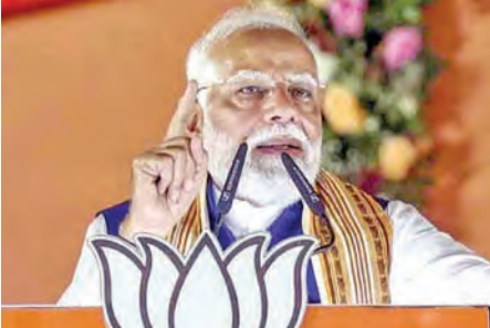
విఫలమైందన్నారు. తల్లులు అనేక బాధలకు గురయితే, భూములు దుర్వినియోగమయ్యాయని, ప్రజలు గత్యంతరం లేక వలసబాటలు పట్టారని విమర్శించారు. రైతుల సంక్షేమానికి టిడీపీ అధిక ప్రాధాన్యం ఇస్తోందని రైతులు, కూలీలు ఆందోళనలను తాము ఆర్థం చేసుకున్నామని చెప్పారు.

పొరబాటుదారుల నుంచి బెంగాల్‌కు విముక్తి కల్పిస్తామని హామీ ఇచ్చారు. బెంగాల్ అభివృద్ధి చెందాలంటే తాము అధికారం చేపట్టాల్సిందేనని అన్నారు. బెంగాల్ అసెంబ్లీ ఎన్నికల్లో టిడీపీకి పూర్తి అనుకూల వసూలు చేయడంపై ప్రధానమంత్రి అన్నారు. తొలి విడత పోలింగ్‌లో భారీ ఓటింగ్‌తో టిఎంసీ గట్టి డెబ్బ తగిలిందని, తుది విడత ముగిసేసరికి టిడీపీ అధికారంలోకి రావడం భాయమని అన్నారు. తొలి విడత పోలింగ్‌లో టిఎంసీ అహంకారం ముక్కైంది. రెండో దశలో టిడీపీకి కీలక విజయం దక్కనుందని చెప్పారు. టిఎంసీ హయాంలో చిన్నస్థాయి నేతలు, గూండాల సైతం అధికారం తమడి అన్నట్లు వ్యవహరించడంతో పాన గాడితప్పిందని, జనాభాదారితనం లోపించిందని మోడీ విమర్శించారు. మా, మాటి, మానుషీ నినాదంతో టిఎంసీ ఎంతోకాలం నమ్మించడంలో, ఈ మూడు వివరాలన్నీ ప్రభుత్వం