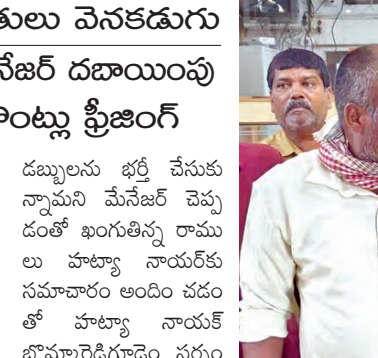
పాట్లకూరులో తెలంగాణ గ్రామీణ షామీనులో మేనేజర్ వాగ్దానం దృశ్యం