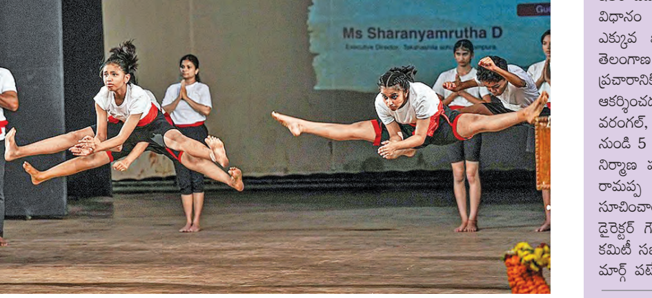
కలరి బట్స్ సందర్భంగా బెంగళూరులో మంగళవారం కలరి బయట్లు యుద్ధ కళలను ప్రదర్శిస్తున్న విద్యార్థులు

సమస్యని పెట్రో నిల్వలు: కమిషనర్ స్పెషల్ రిపోర్ట్ తెలంగాణలో పెట్రోల్, డిజిల్ నిల్వలు, సరఫరా సమస్యిగా ఉన్నట్లు పౌర సరఫరాలశాఖ కమిషనర్ స్పెషల్ రిపోర్ట్ ఒక ప్రకటనలో తెలిపారు. సామాజం డిమాండ్ ను మించి పెట్రోల్, డిజిల్ ను 29, 9, 39 కిలో లీటర్లు సరఫరా చేసినట్లు వివరించారు. నాలుగు కిలో లీటర్లకు 5, 883 కిలో లీటర్లకు 7, 348 కిలో లీటర్లు డిజిల్ కు డిమాండ్ ఉండేదని తెలిపారు. సరఫరాను క్షేత్ర స్థాయి అధికారులు, పెట్రోల్ కంపెనీల ప్రతినిధులతో క్రమంతుకుండా పర్యవేక్షిస్తున్నట్లు తెలిపారు.