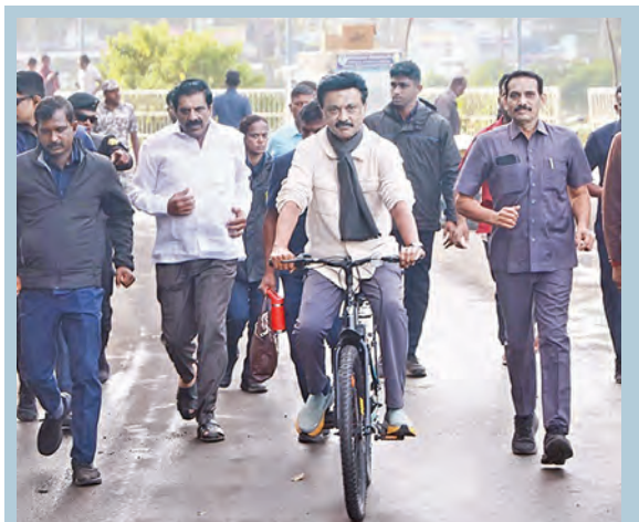
కొడైకెనాల్ సరస్సు దగ్గర మంగళవారం సైకిల్ తోక్తుతున్న ఎన్నికల ప్రదారంలో పాల్గొన్న తమిళ ముఖ్యమంత్రి ఎంకే స్టాలిన్