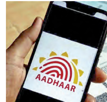
రంగా సస్పెండ్ అటోమేటిక్ గా ఏ ఏ ఏ జనవరి 1వ తేదీని పుట్టిన తేదీగా తీసుకుంటుంది. అందుకే ఇది అన్ని వేళలా కచ్చితమైనది కాదని స్పష్టం చేసింది. ఆధార్ కార్డు సమర్పించిన వ్యక్తి, యువణిఎం టీకీ దేఖా ప్రకారం అతను అనలైన్ వ్యక్తి అవుతూ కాదా అనే విషయాన్ని

న్యూఢిల్లీ, ఏప్రిల్ 28. ఆధార్ ను కేవలం గుర్తింపు పత్రంగానే పరిగణించాలని, పుట్టిన తేదీ ద్రువీకరణ పత్రంగా కాదని పేర్కొంటూ ఉత్తర్వులు జారీ చేసింది. ఆధార్ కార్డులో పుట్టిన తేదీ (డీవోబి) ముద్రించి ఉన్నట్లు టీకీ, దానిని అధికారిక పుట్టిన తేదీ ద్రువీకరణ పత్రంగా పరిగణించకూడదని స్పష్టం చేస్తూ ఆధార్ యాజ్ఞా ఏజెన్సీలు, ఈ కేవలం యాజ్ఞా ఏజెన్సీలకు యువణిఎం లేఖ రాసింది. ఆధార్ అనేది ఒక వ్యక్తి యొక్క గుర్తింపును ప్రతిబింబించడానికి ఉద్దేశించినది మాత్రమేనని యువణిఎం అందించింది. ఆధార్ నమోదు సమయంలో వినియోగదారులు ఇచ్చే సమాచారం లేదా సూత్ర సర్టిఫికేట్లు, పాస్ పోర్ట్ వంటి పత్రాల మేరకు పుట్టిన తేదీని నమోదు చేస్తారు. ఒకవేళ వినియోగదారుడి వద్ద ఎలాంటి అధికారిక పత్రాలు లేకపోతే, వారి వయస్సు అంచనా ఆధారంగా సస్పెండ్ అటోమేటిక్ గా ఏ ఏ ఏ ఏ జనవరి 1వ తేదీని పుట్టిన తేదీగా తీసుకుంటుంది. అందుకే ఇది అన్ని వేళలా కచ్చితమైనది కాదని స్పష్టం చేసింది. ఆధార్ కార్డు సమర్పించిన వ్యక్తి, యువణిఎం టీకీ దేఖా ప్రకారం అతను అనలైన్ వ్యక్తి అవుతూ కాదా అనే విషయాన్ని