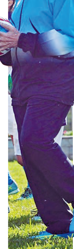
గ్యాంగ్ టుక్ట్లో మంగళవారం యువతతో పుట్టాల్ ఆడిన ప్రధాని మోడీ

నాకిష్టం పుట్టాలాట! గ్యాంగ్ టుక్ట్లో యువతతో కలిసి సరదాగా ప్రధాని ఆటలు 2